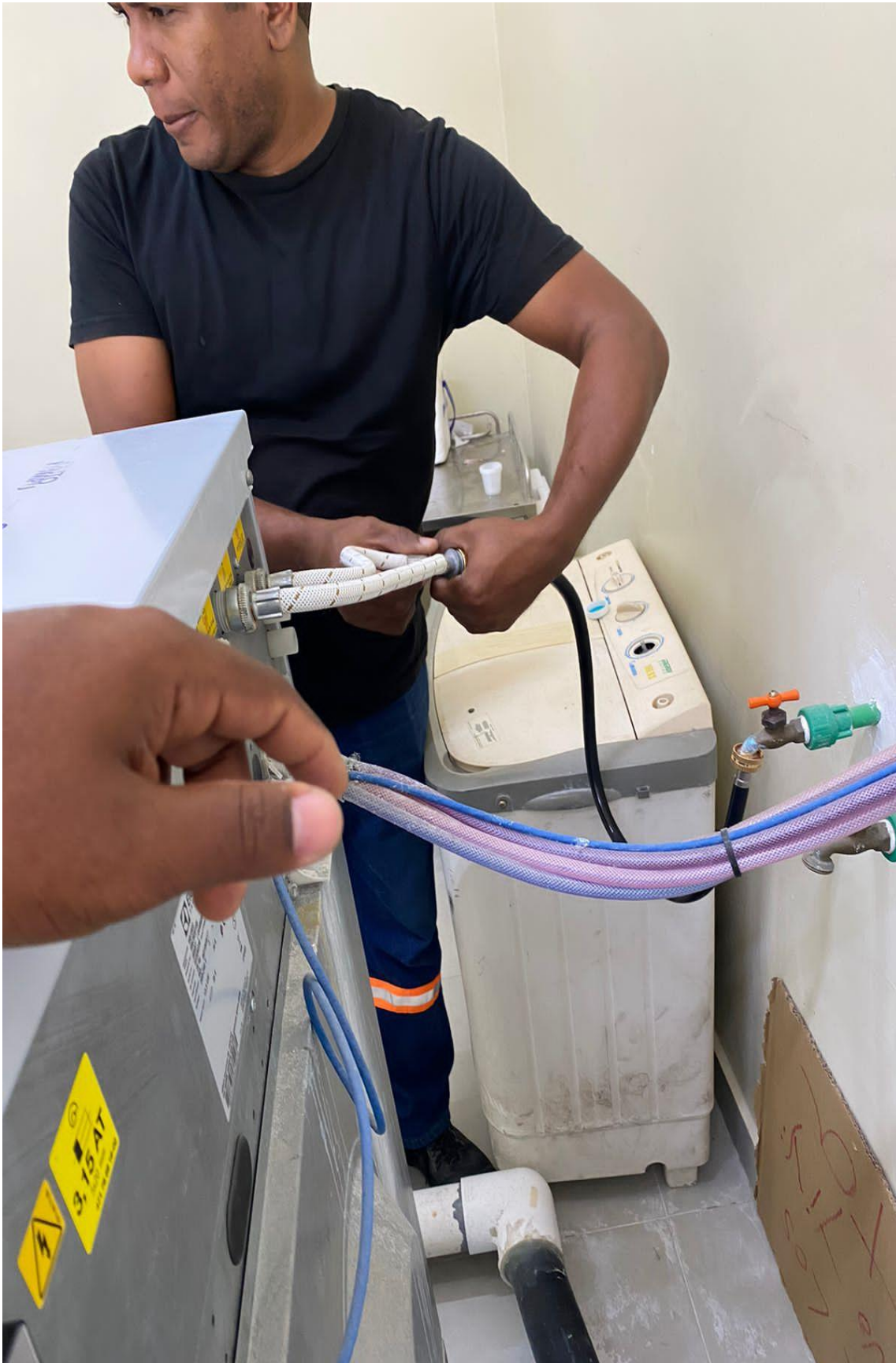
Cambio de manguera monomando