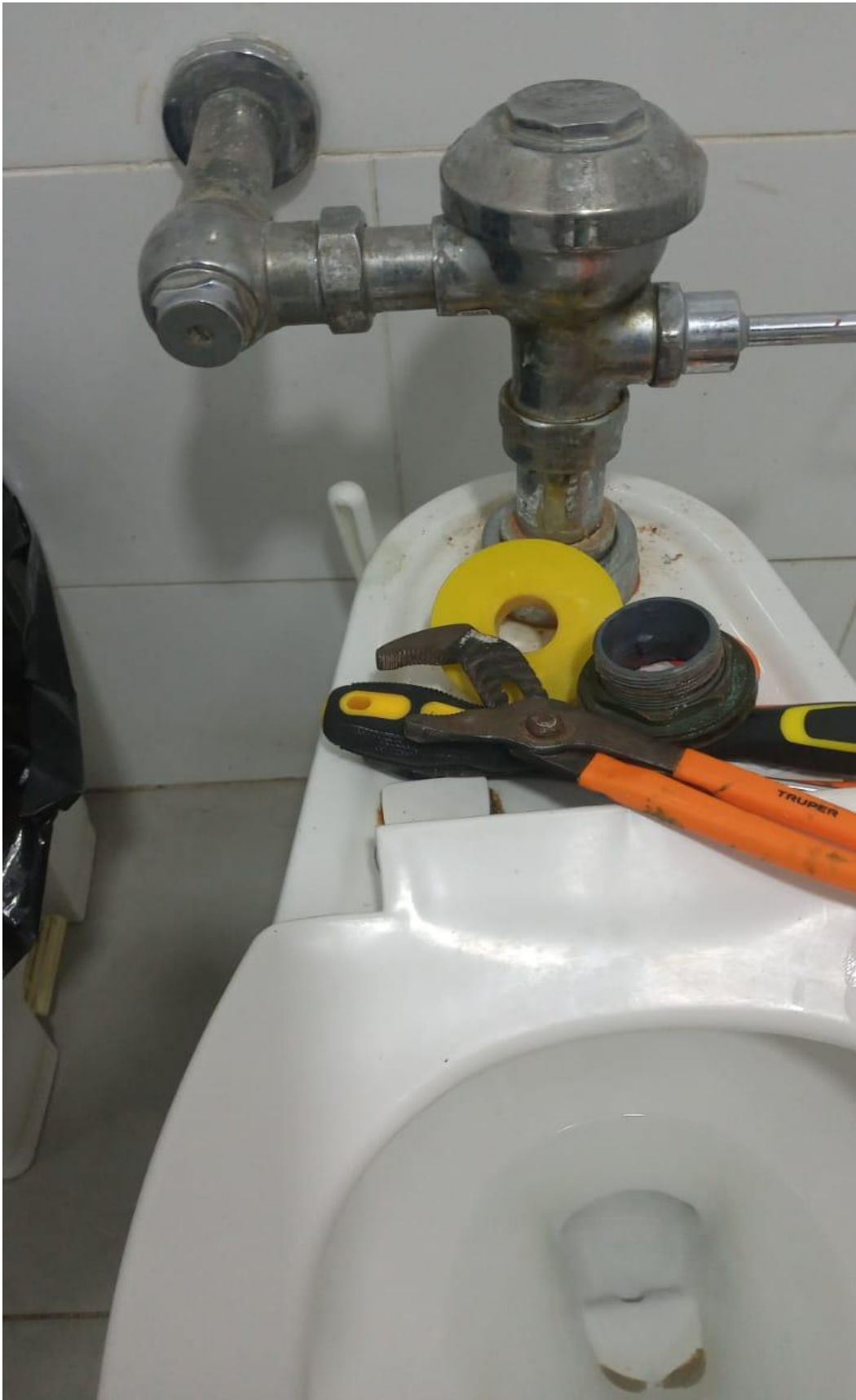
Solución a fuga de agua 28/02/2024