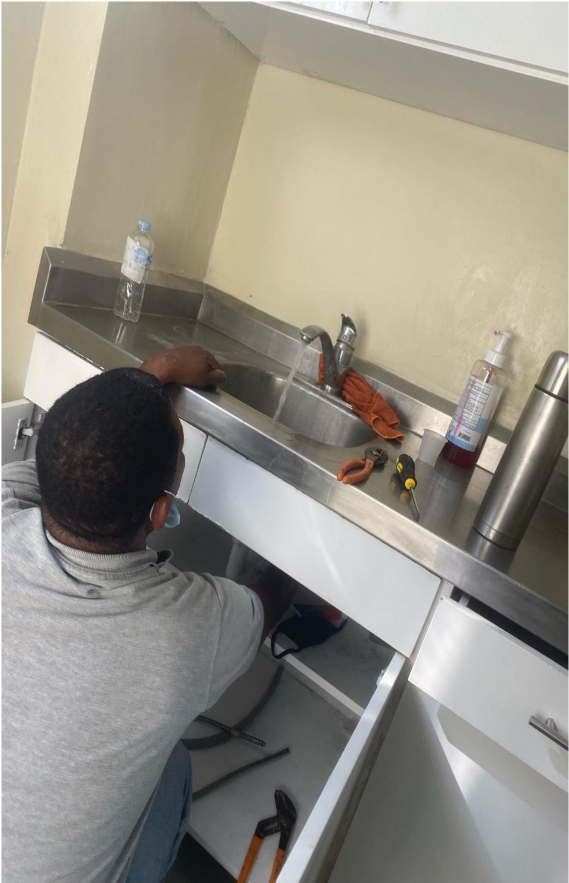
Solución a fuga de agua 05/02/2024