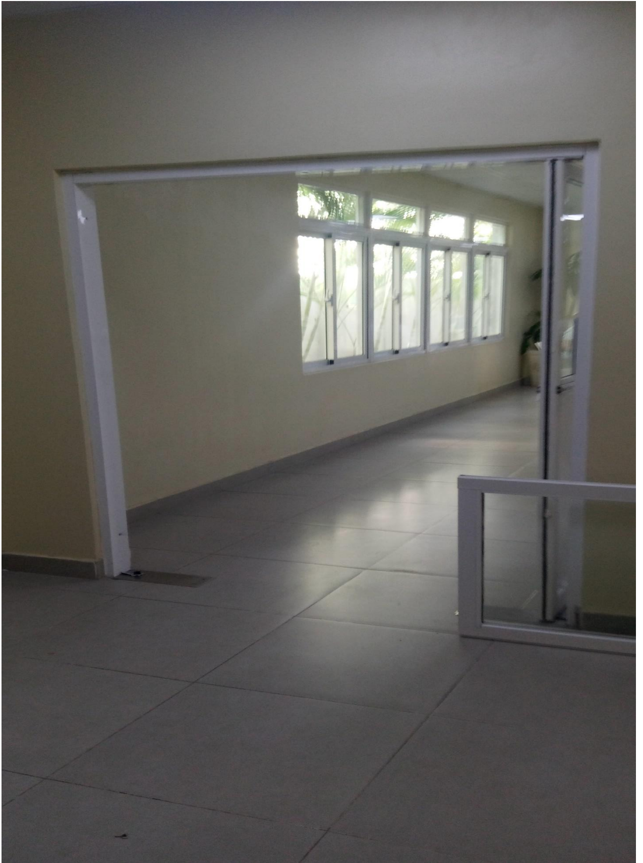
Puerta de pasillo de internamiento 23/02/2024