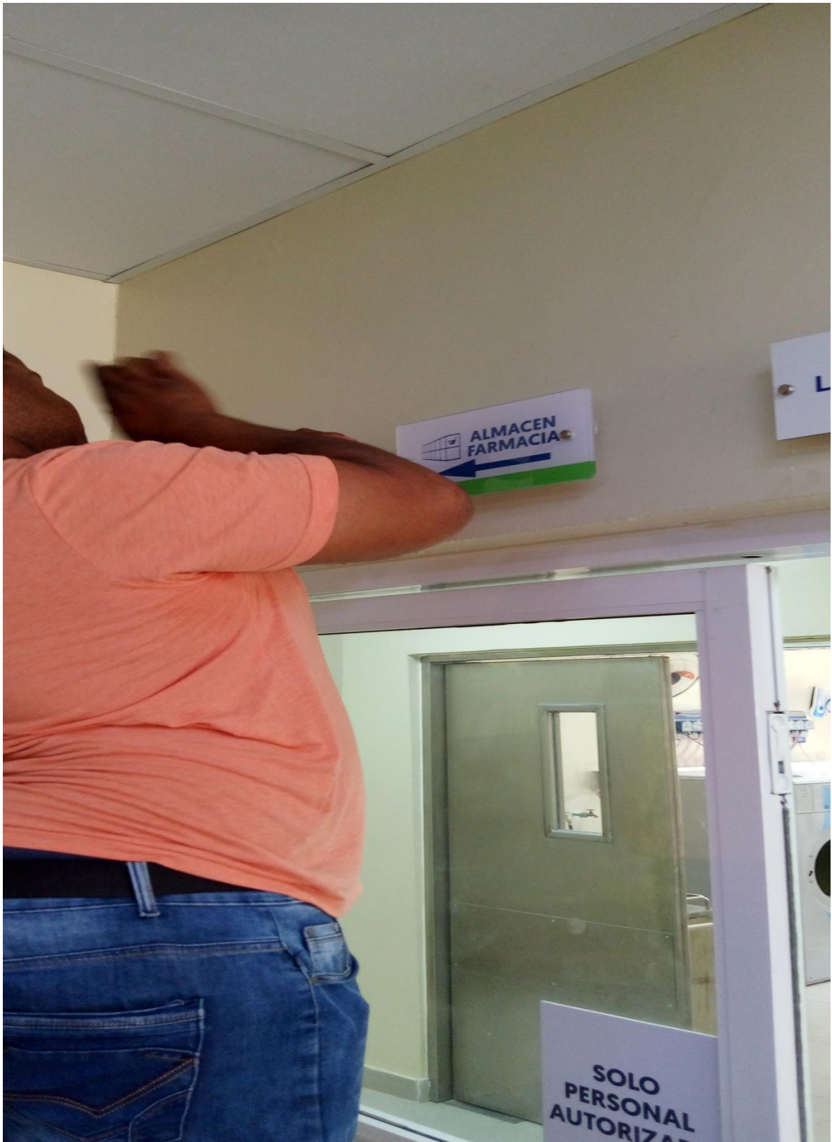
Instalación de letrero de almacén 09/02/2024