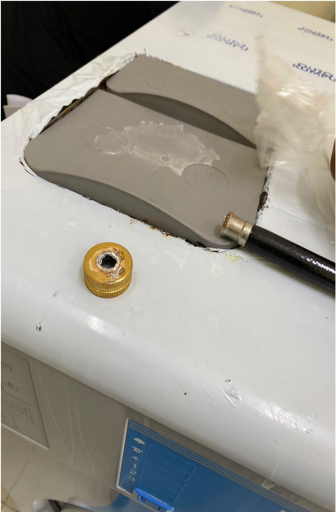
Cambio de manguera monomando 20/02/2024