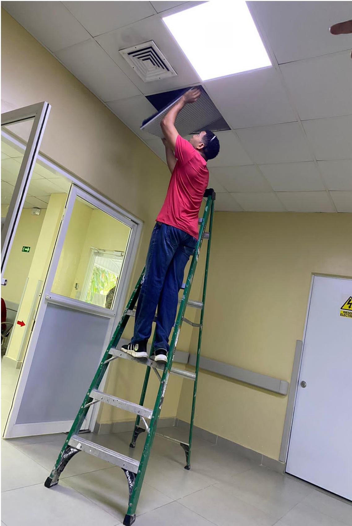
Pasillo de internamiento 20/02/2024