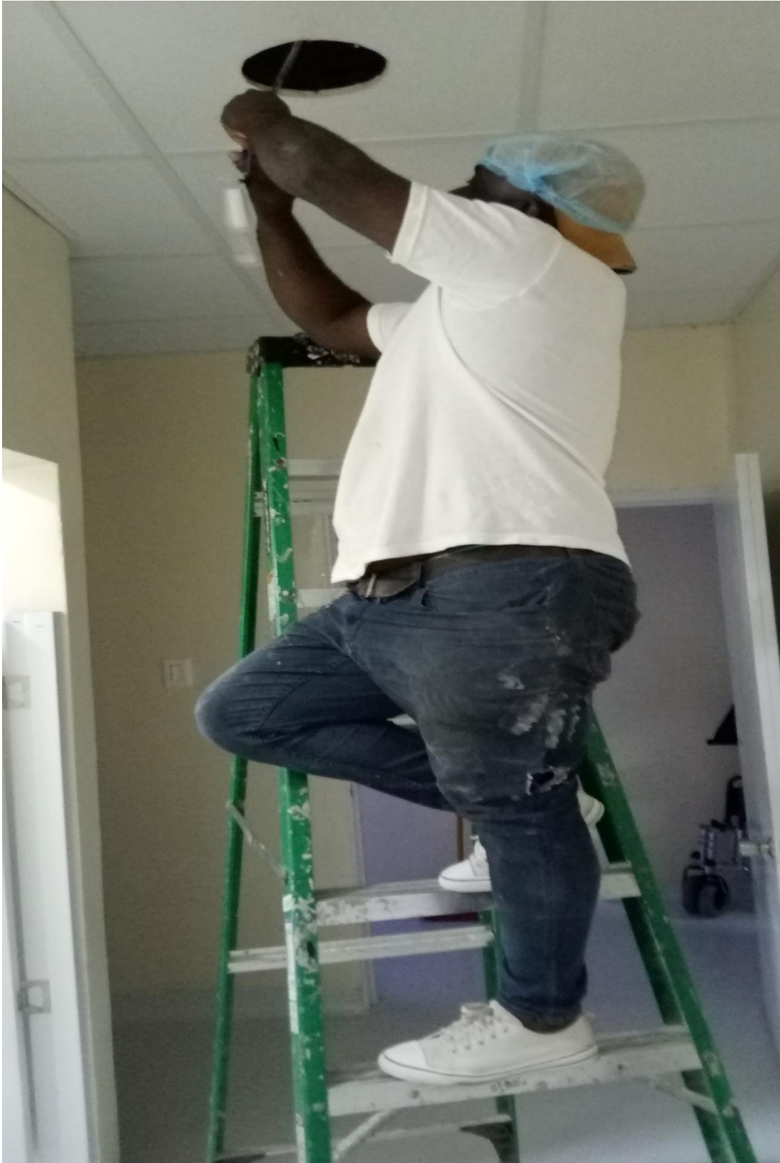
Cambio de lámpara 18W 02/02/2024