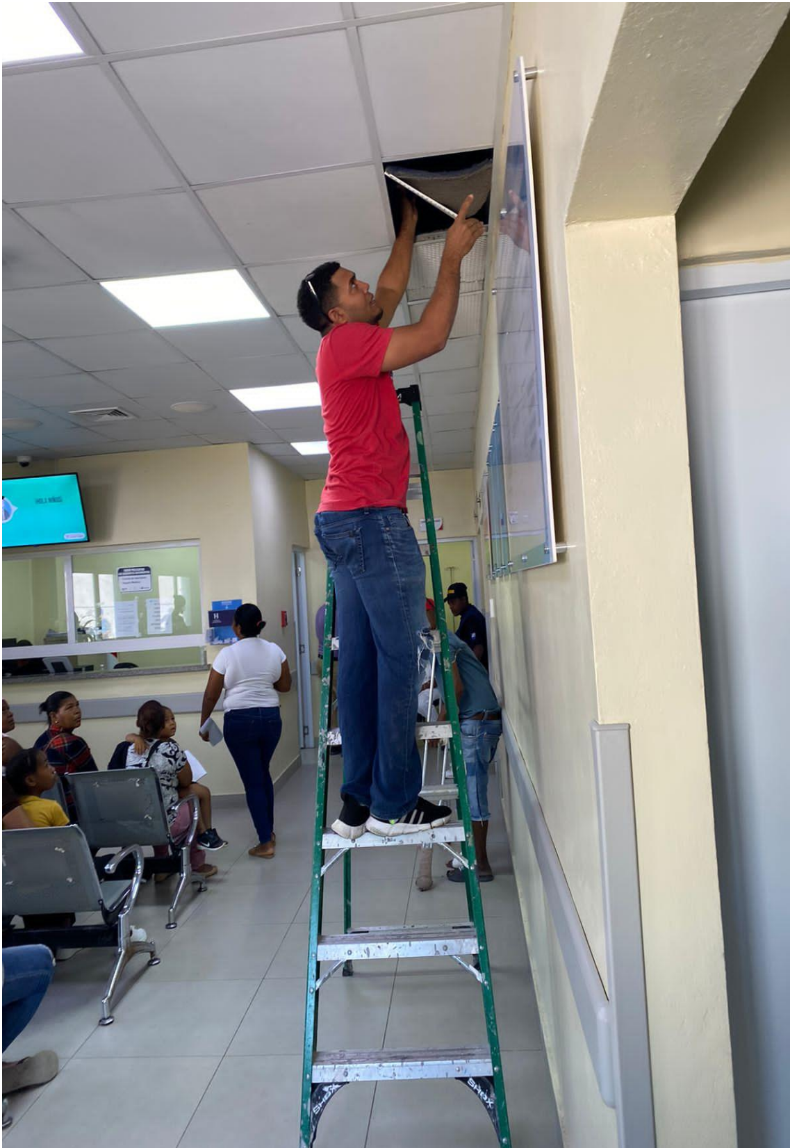
Filtros de emergencia 20/02/2024