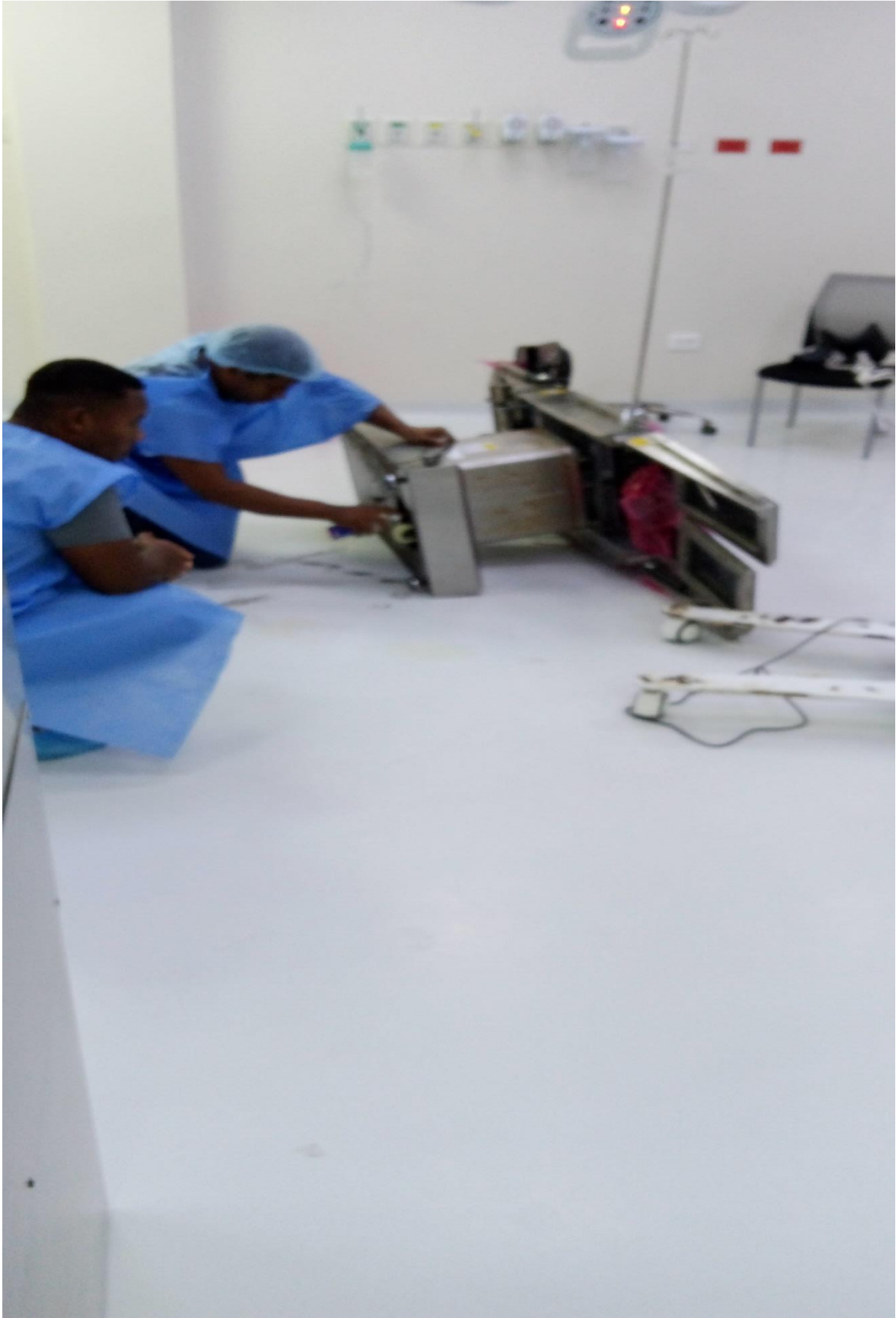
Mantenimiento a cama de cirugía 09/02/2024