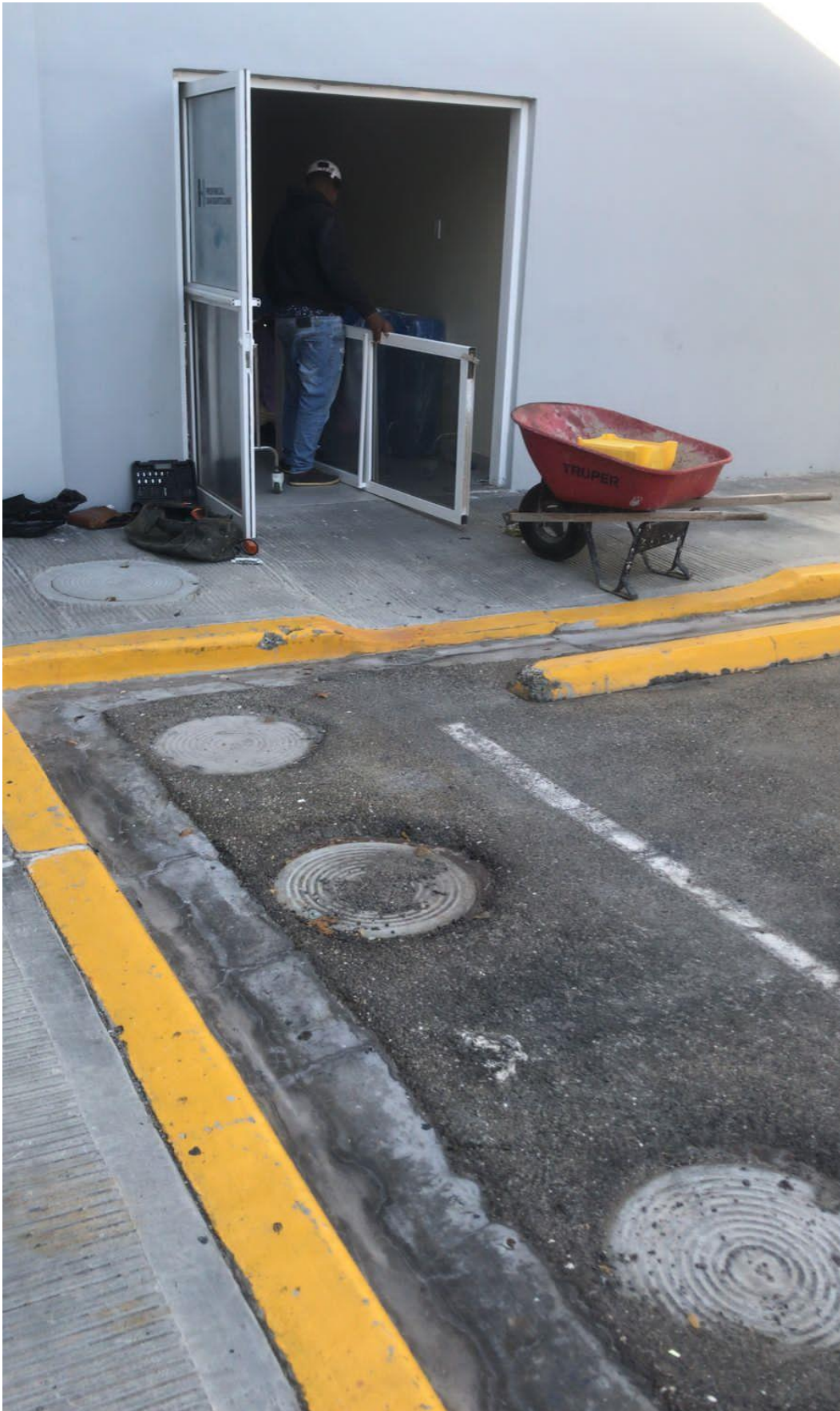
Arreglo de puerta de la morgue 23/02/2024