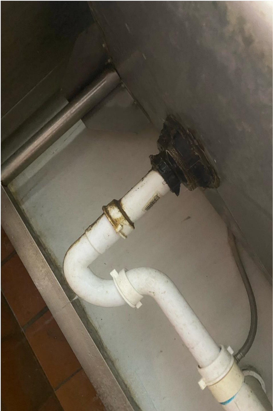
Solución a fuga de agua 06/02/2024