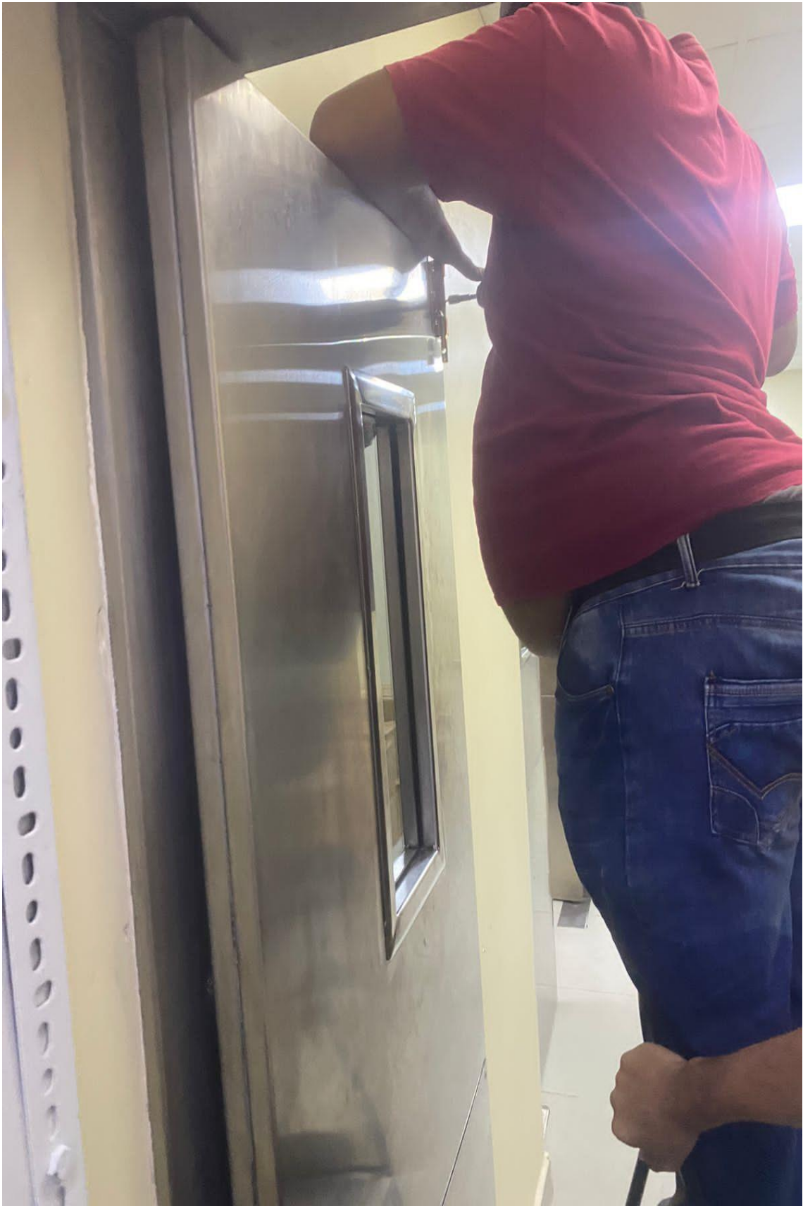
Pestillo a la puerta de almacén 02/02/2024