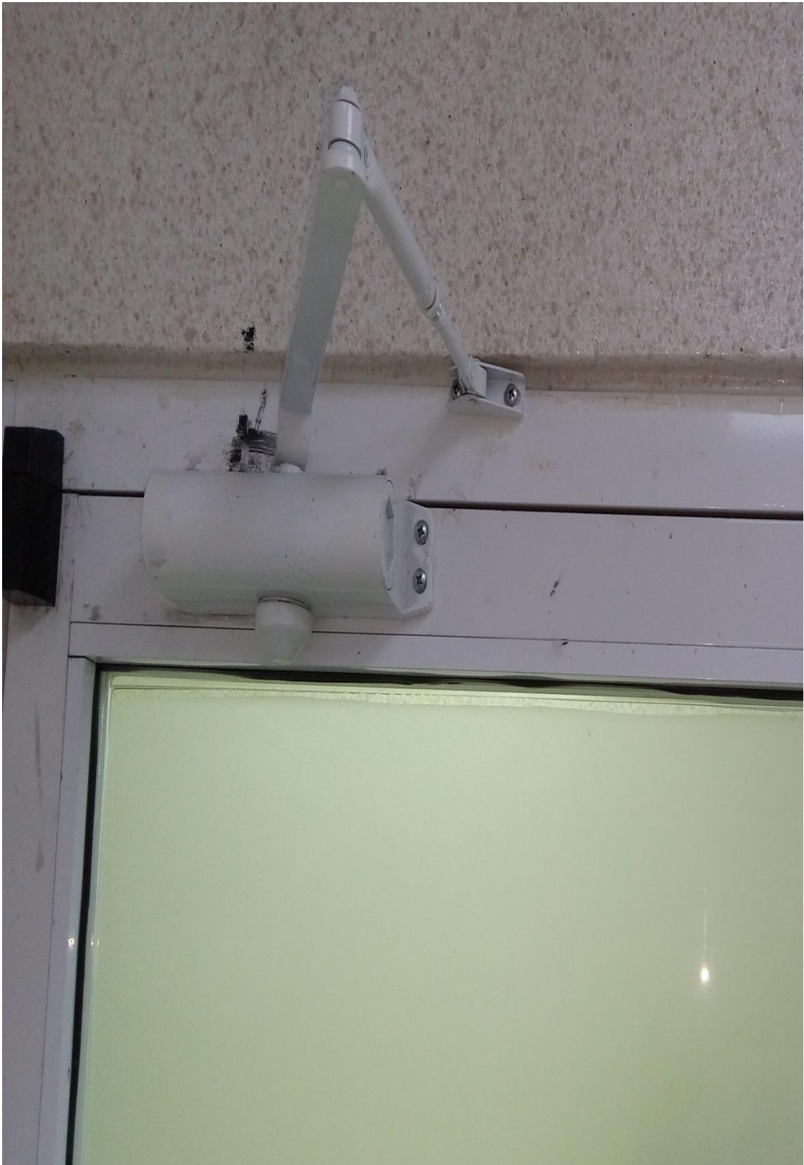
Cierre de puerta 23/02/2024