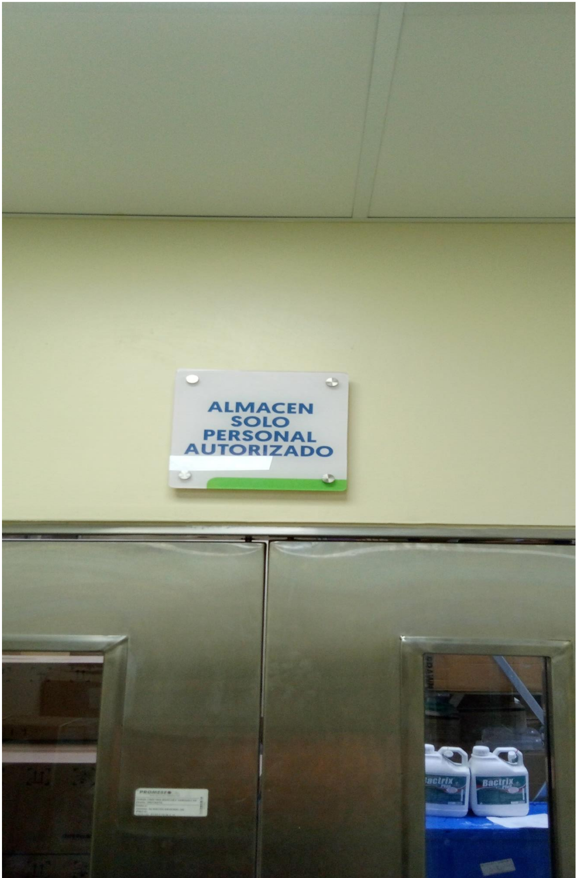
Instalación de letrero de almacén 09/02/2024