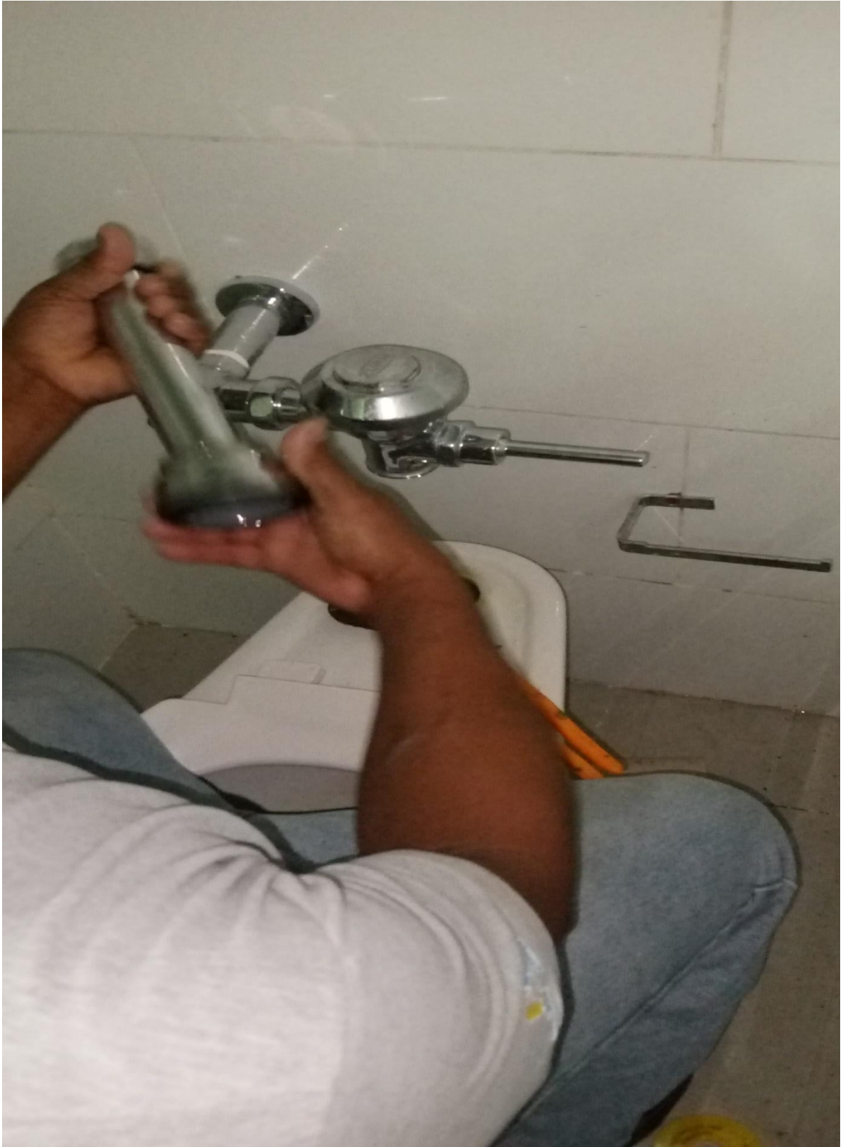
Solución a fuga de agua 05/02/2024