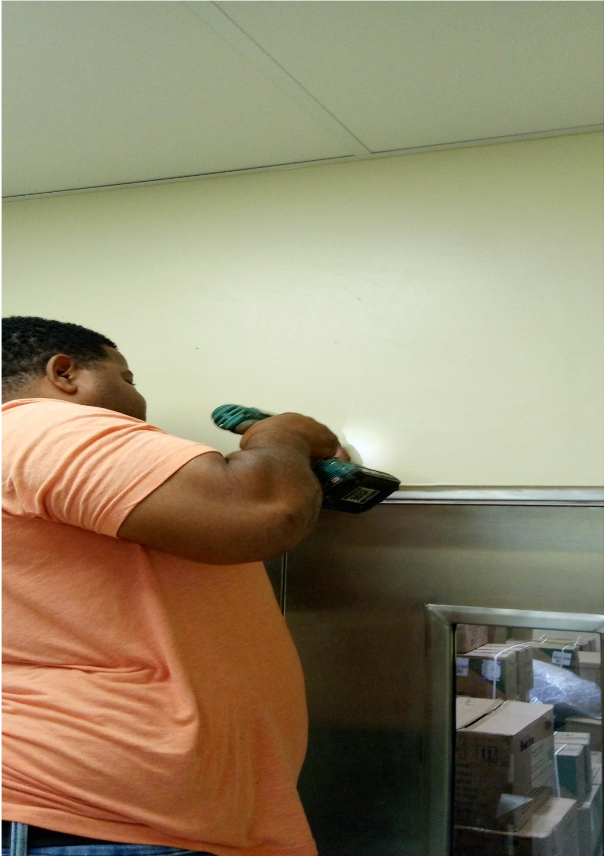
Instalación de letrero de almacén 09/02/2024