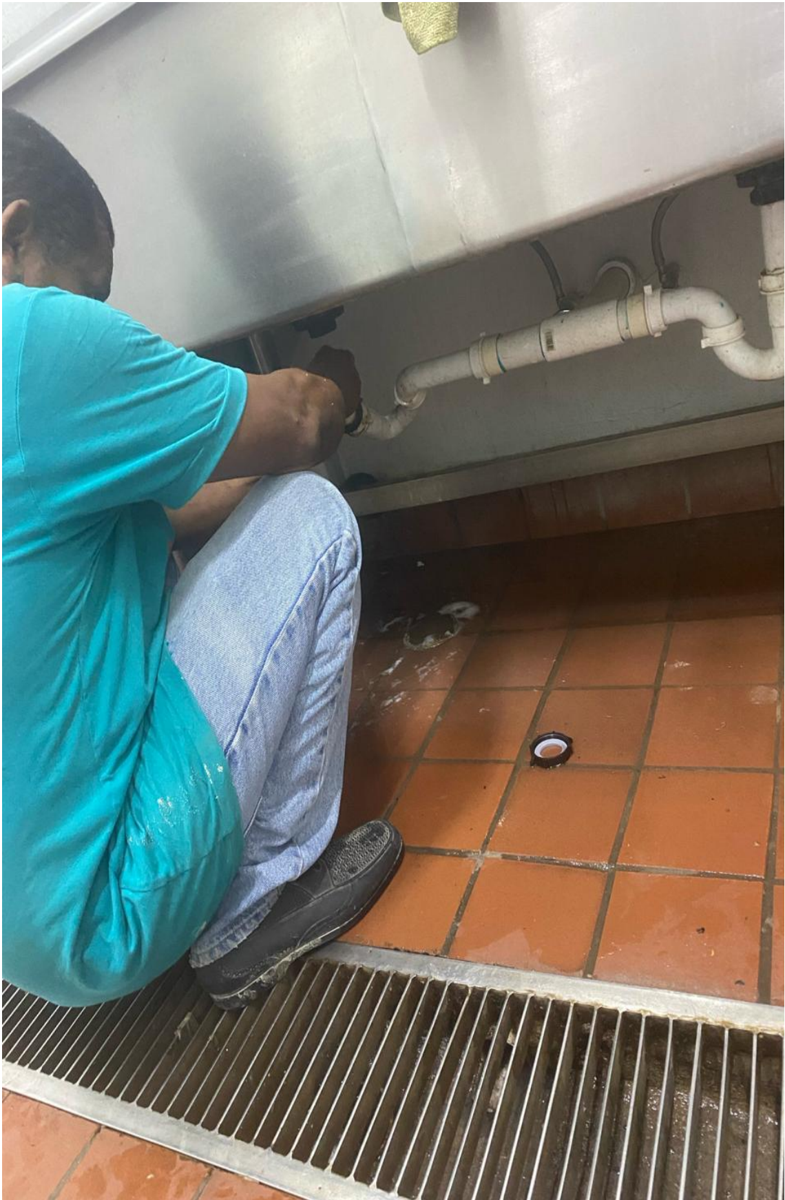
Solución a fuga de agua 06/02/2024