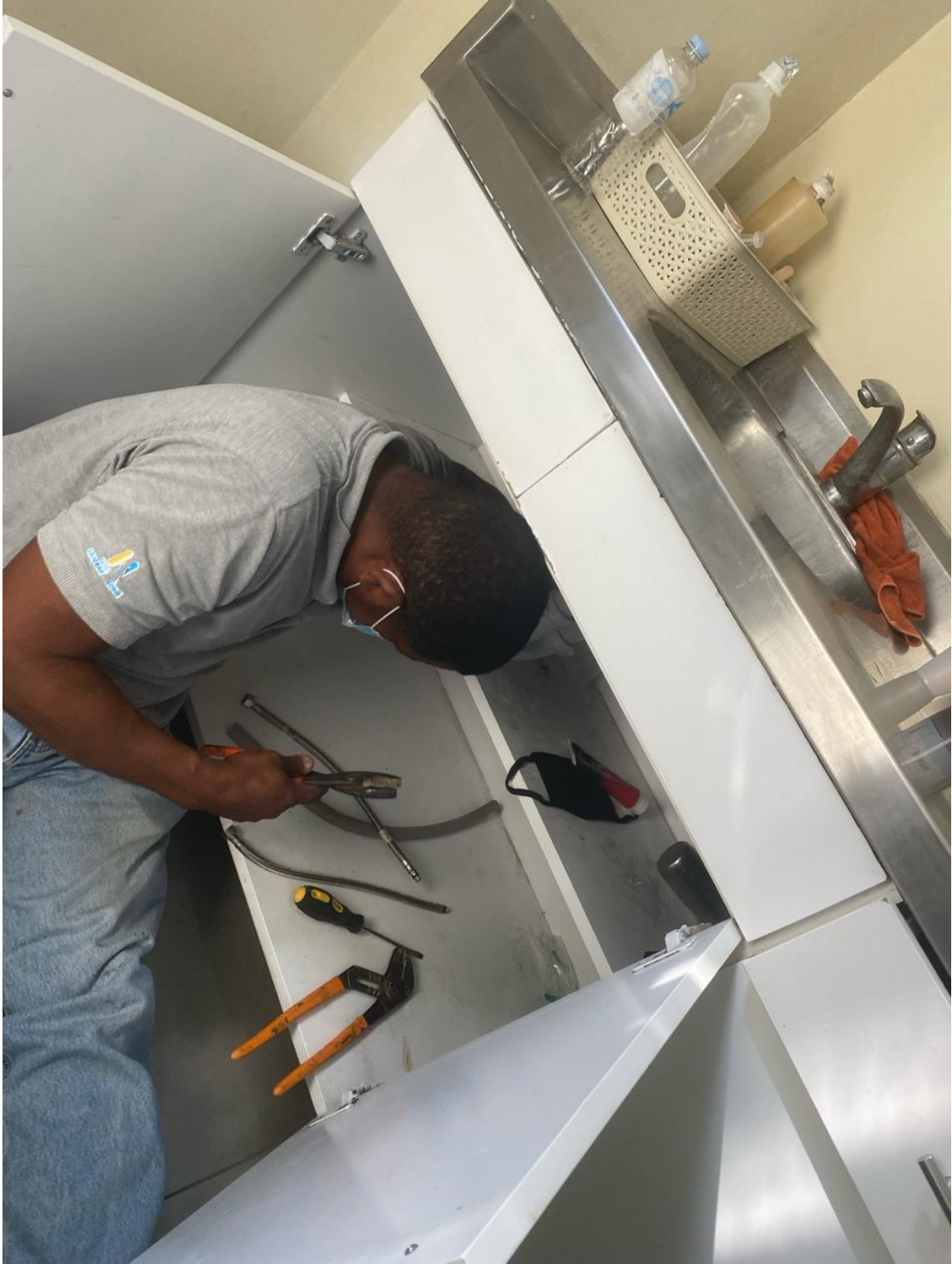
Solución a fuga de agua 05/02/2024