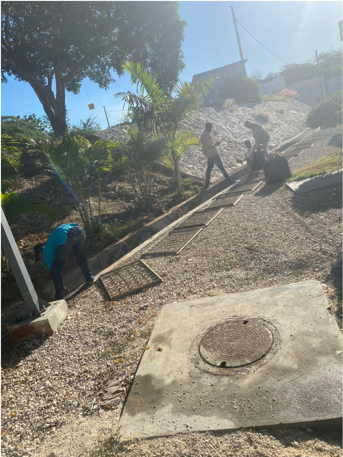
Limpeza de canal de desagüe. 02/02/2024