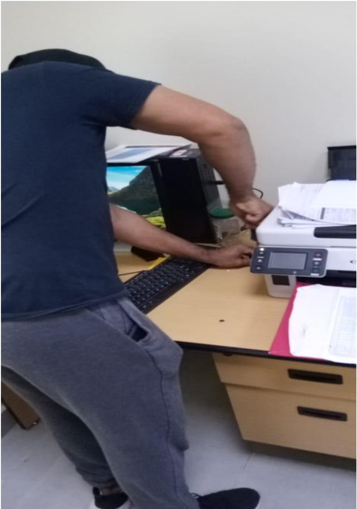
Arreglo de escritorio de estadística