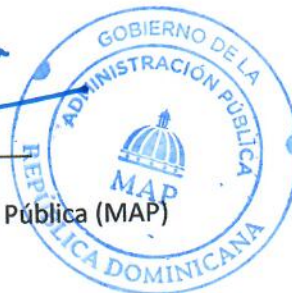
Lic. Darío Castillo Lugo Ministro del Ministerio de Administración Pública (MAP)