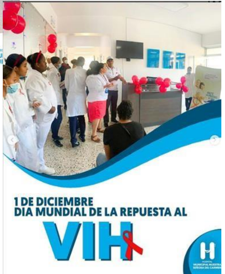
Charlas sobre temas de interés para la comunidad