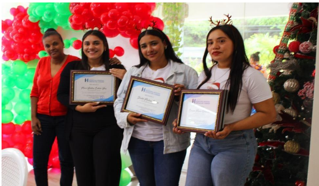
Actividad de reconocimiento a los colaboradores