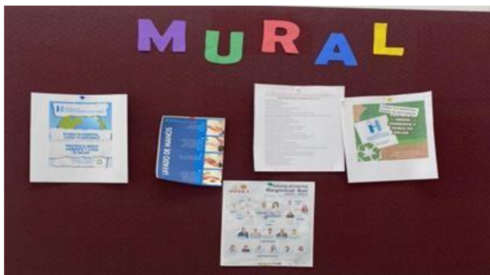
Comunicación de temas relevantes mediante el mural informativo