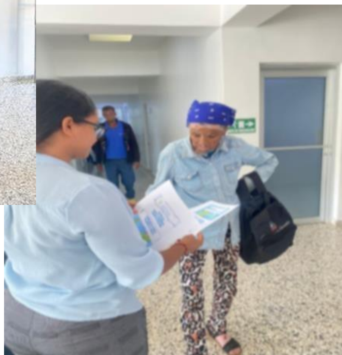
Interacciones con los usuarios