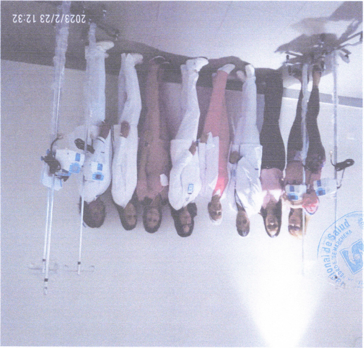
Taller y entrega de bombas a las áreas de uci, uci Ped y uci neonatal