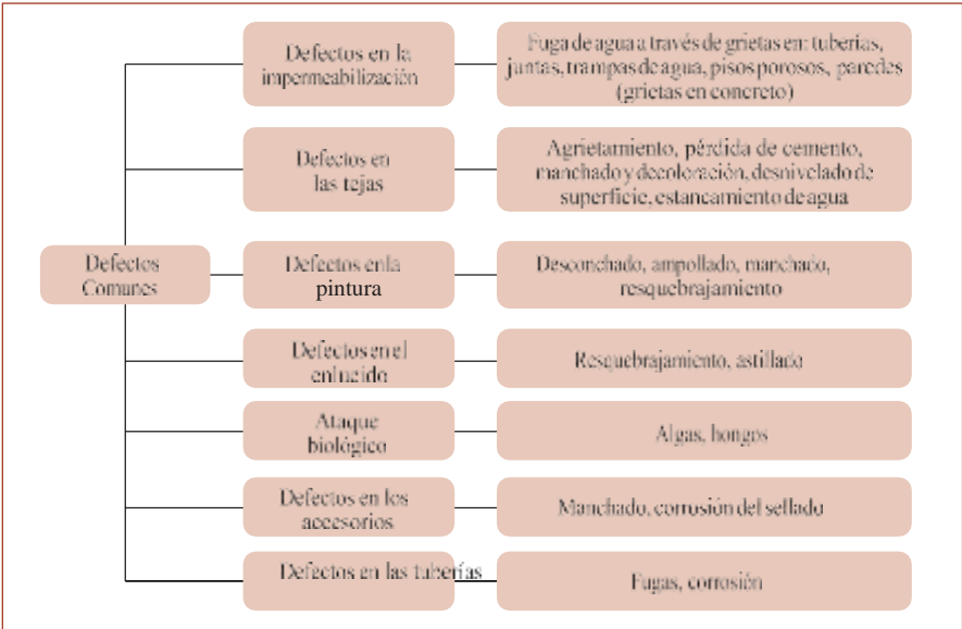
Defectos comunes en elementos de la infraestructura de los establecimientos de salud

Las inspecciones programadas facilitan detectar en forma oportuna los defectos comunes que se presentan principalmente en los elementos no estructurales de las edificaciones de salud, entre los cuales tenemos algunos de los mencionados en la figura 2.