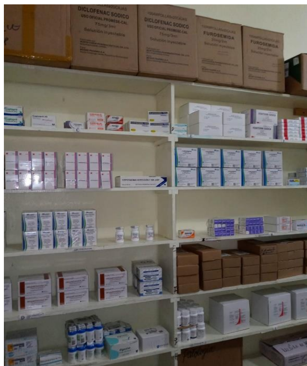
Fig. 6. Estante de medicamentos