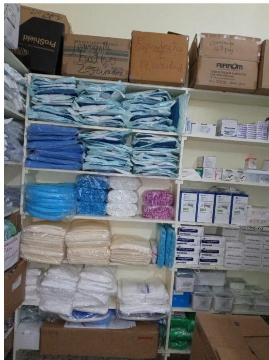
Fig.8. Materiales quirúrgicos