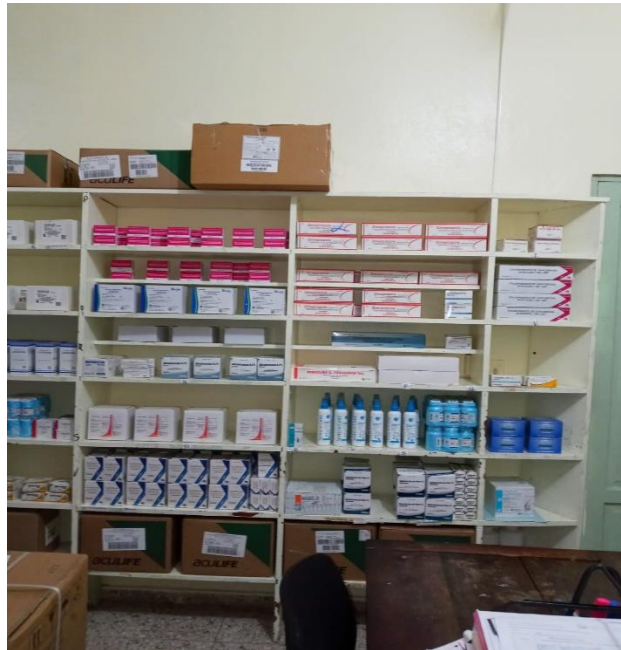
Fig. 5. Estante de medicamentos