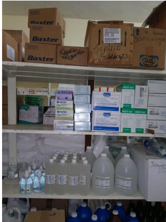
Fig. 9. Materiales e insumos