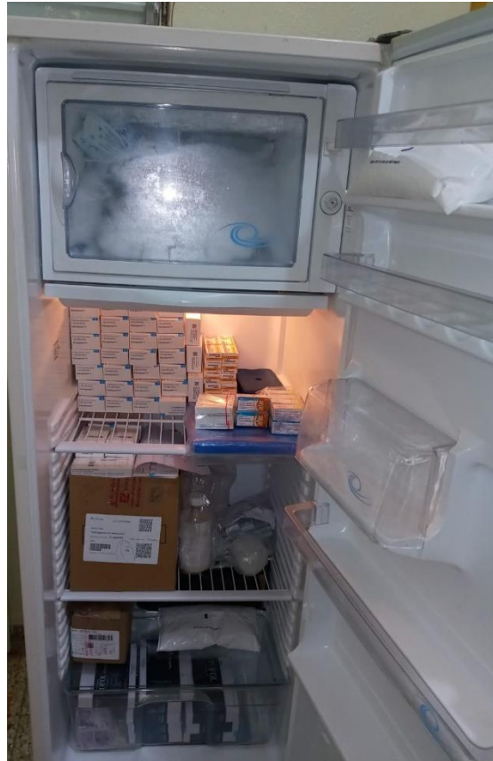
Fig. 7. Nevera de medicamentos