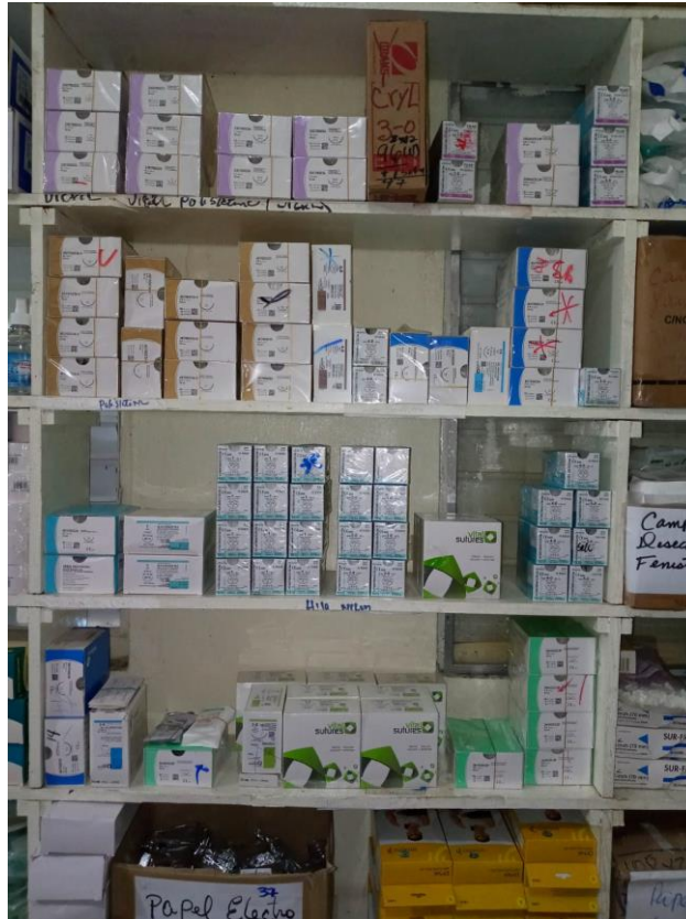
Fig. 11. Materiales de sutura