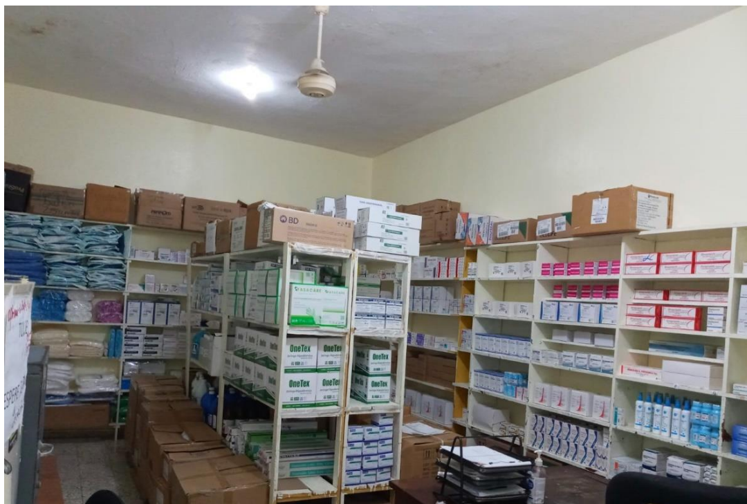
Fig. 4. Área de almacén de medicamentos