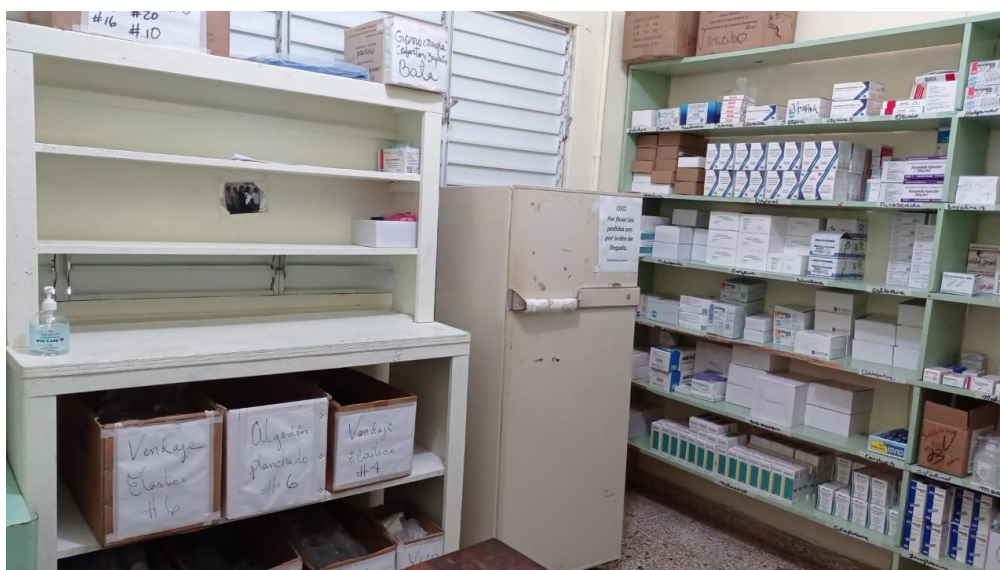
Fig.2. Área de insumos y material gastable