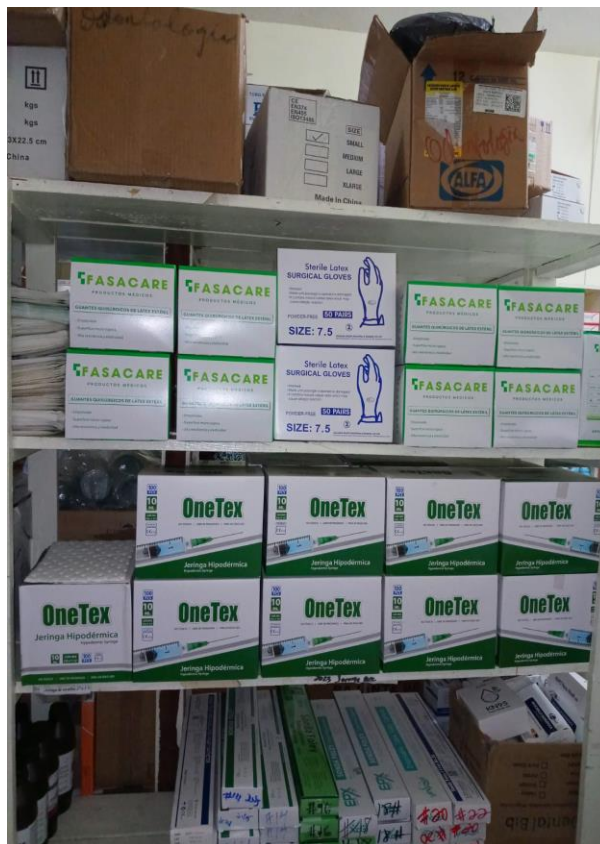
Fig. 10 Materiales e insumos