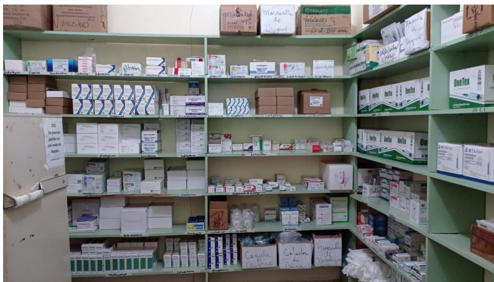
Fig.1. Estante de medicamentos

Los medicamentos se reciben en el área del almacén para luego ser clasificados y enviados al área de farmacia.