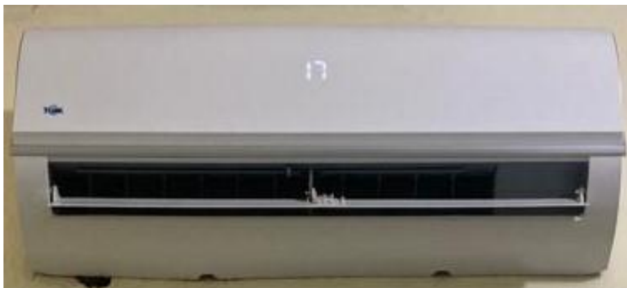
Fig.3. Aire acondicionado de farmacia