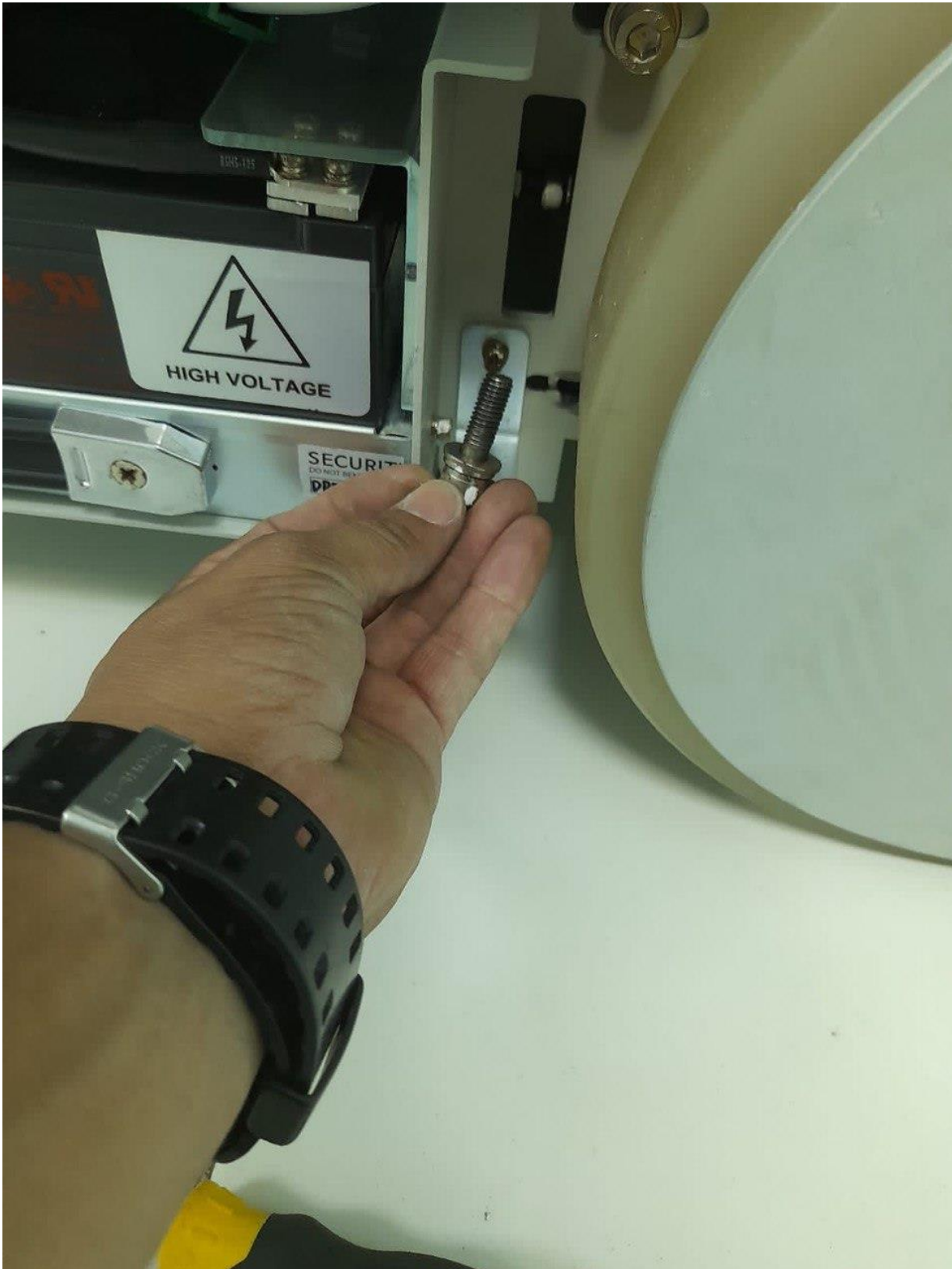
MANTENIMIENTO PREVENTIVO EQUIPOS CLIMATIZACION