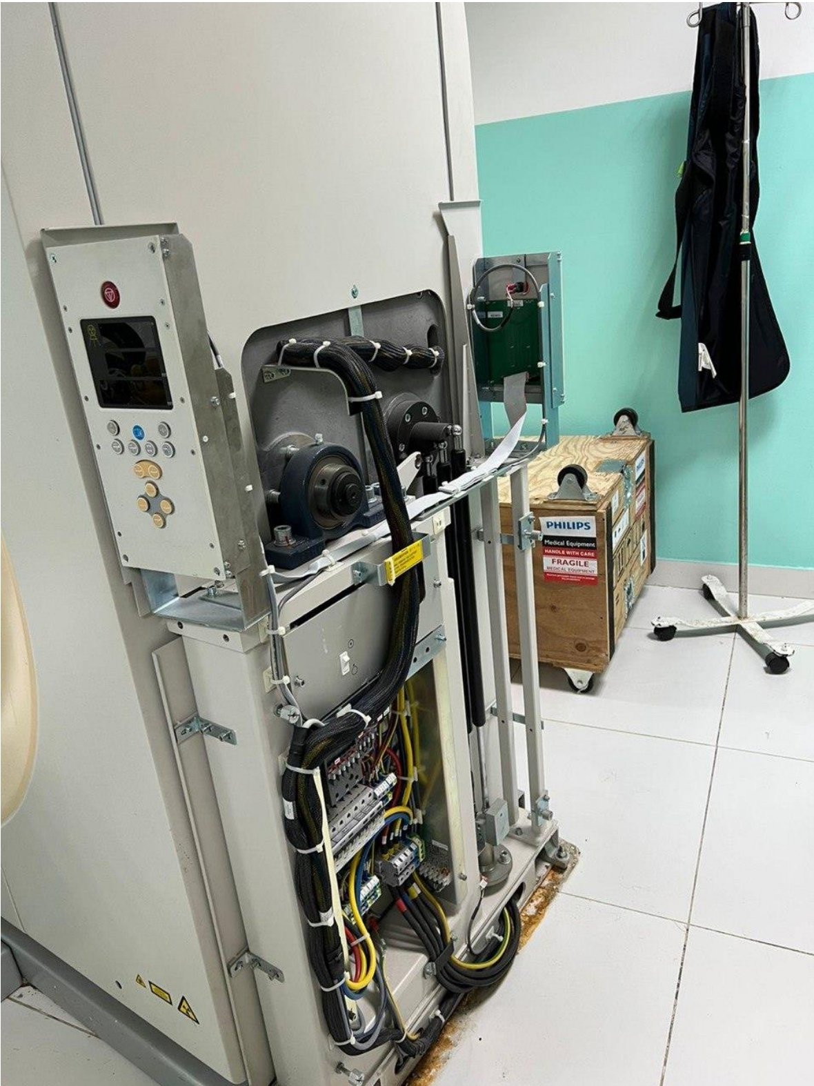
MANTENIMIENTO PREVENTIVO AUTO CLAVES