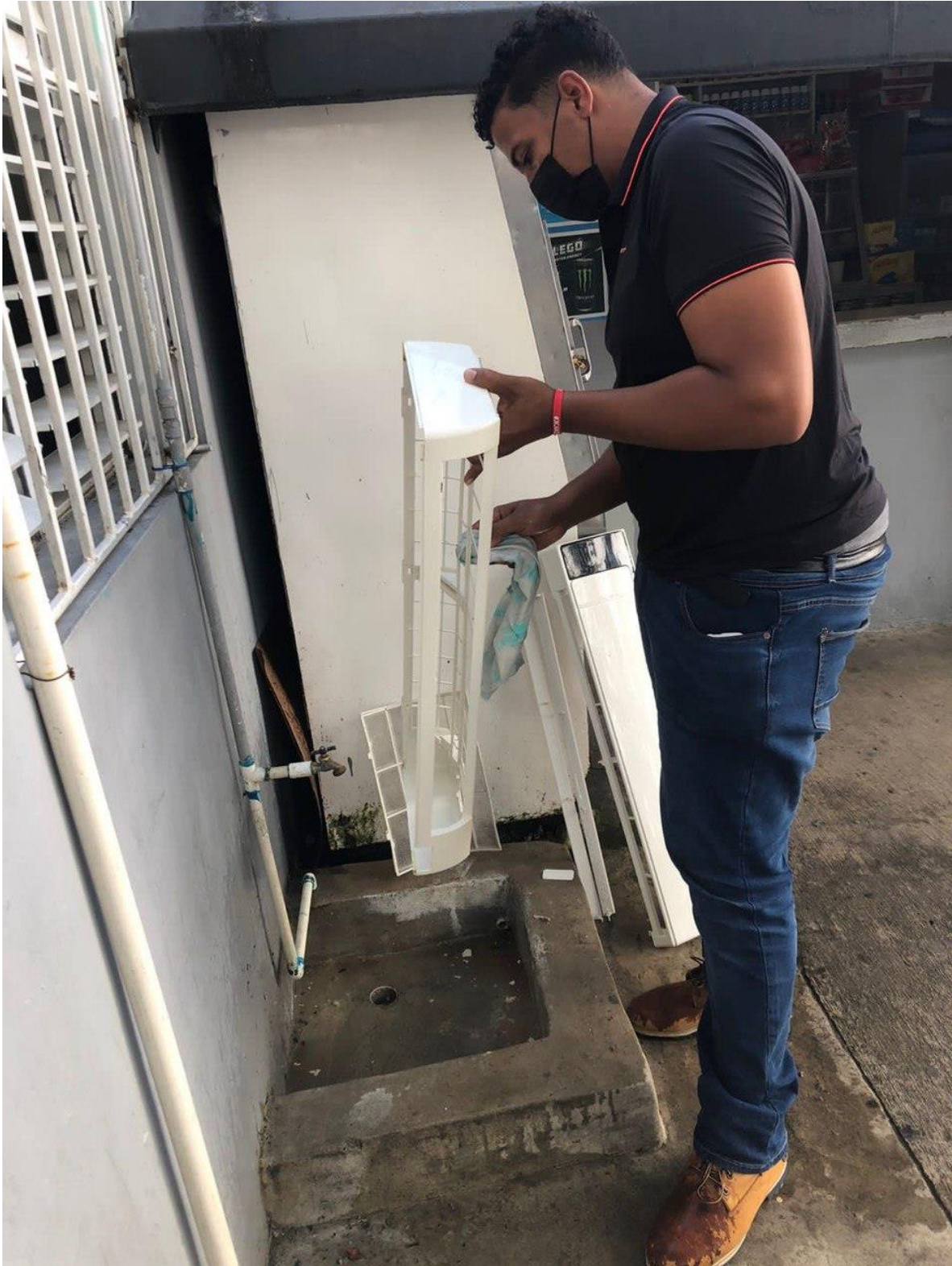
MANTENIMIENTO PREVENTIVO INFRAESTRUCTURA