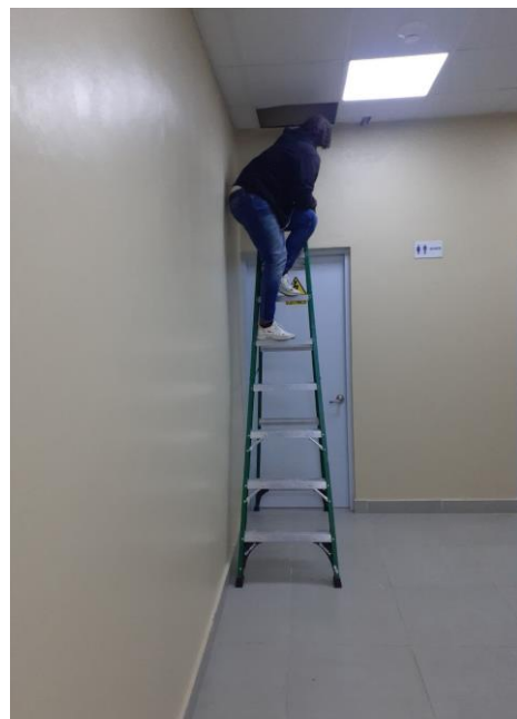
INSTALACION DE CAMARAS DE VIGILANCIA EN DIFERENTES LUGARES, PASILLO DE BAÑO, COCINA, FACTURACION DE EMERGENCIA