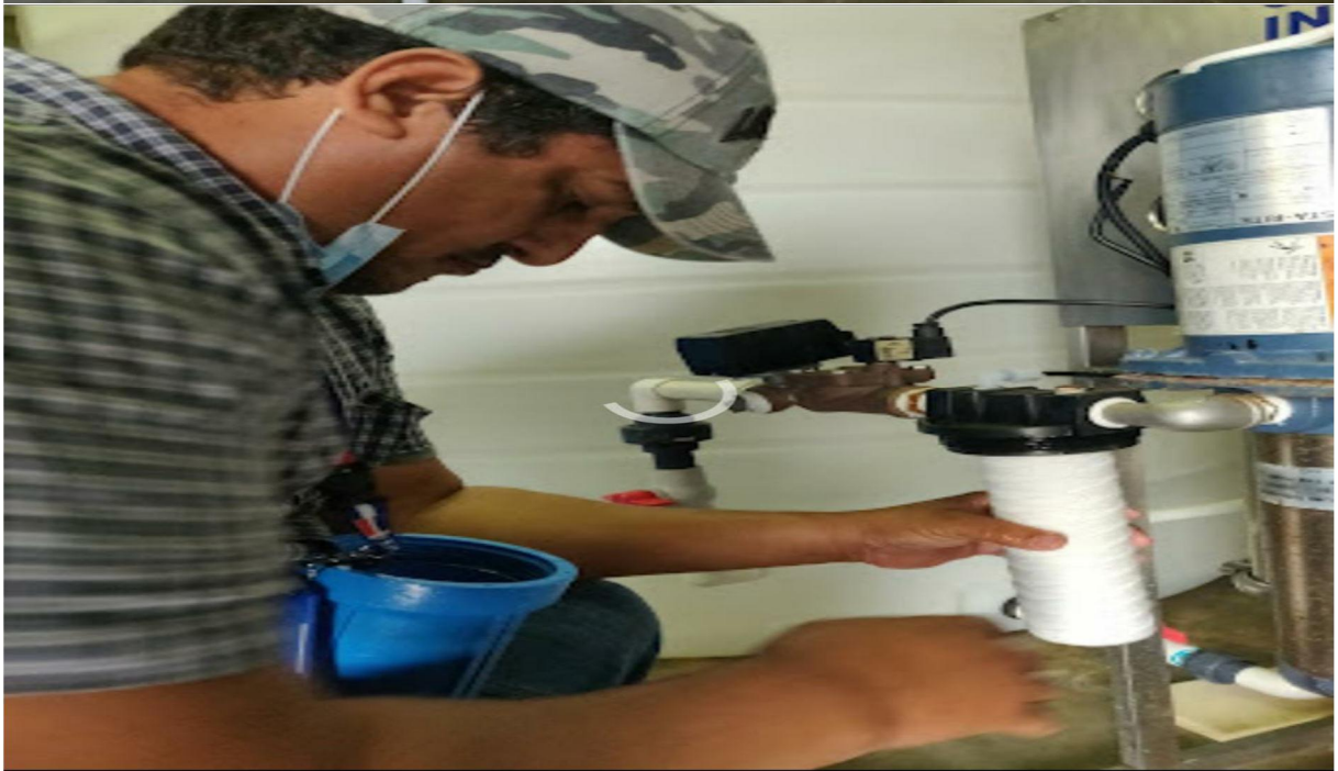
Mantenimiento a Planta OSMOSIS