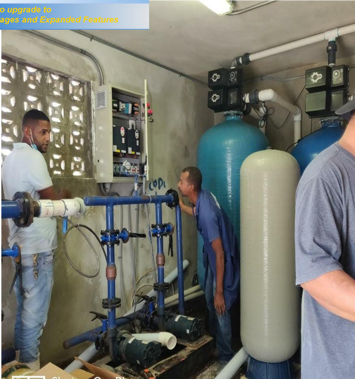
Reestructuración del cuarto de bomba