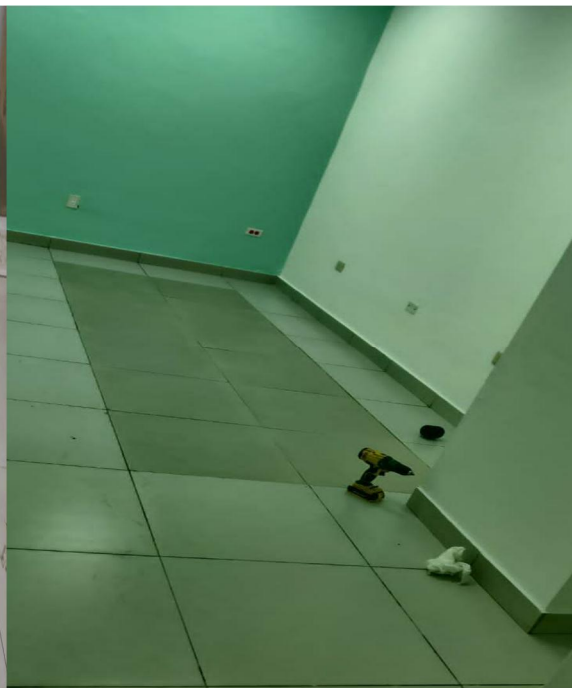
Adecuación de espacio para Oficina de Enfermería