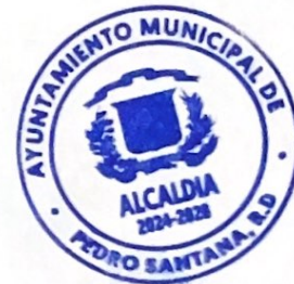
Starlin A. Contreras Aquino Alcalde Municipal de Pedro Santana