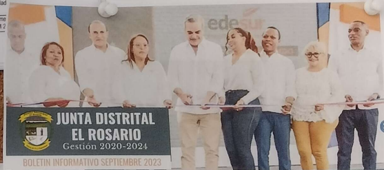
JUNTA DISTRITAL EL ROSARIO Gestión 2020-2024 BOLETIN INFORMATIVO SEPTIEMBRE 2023