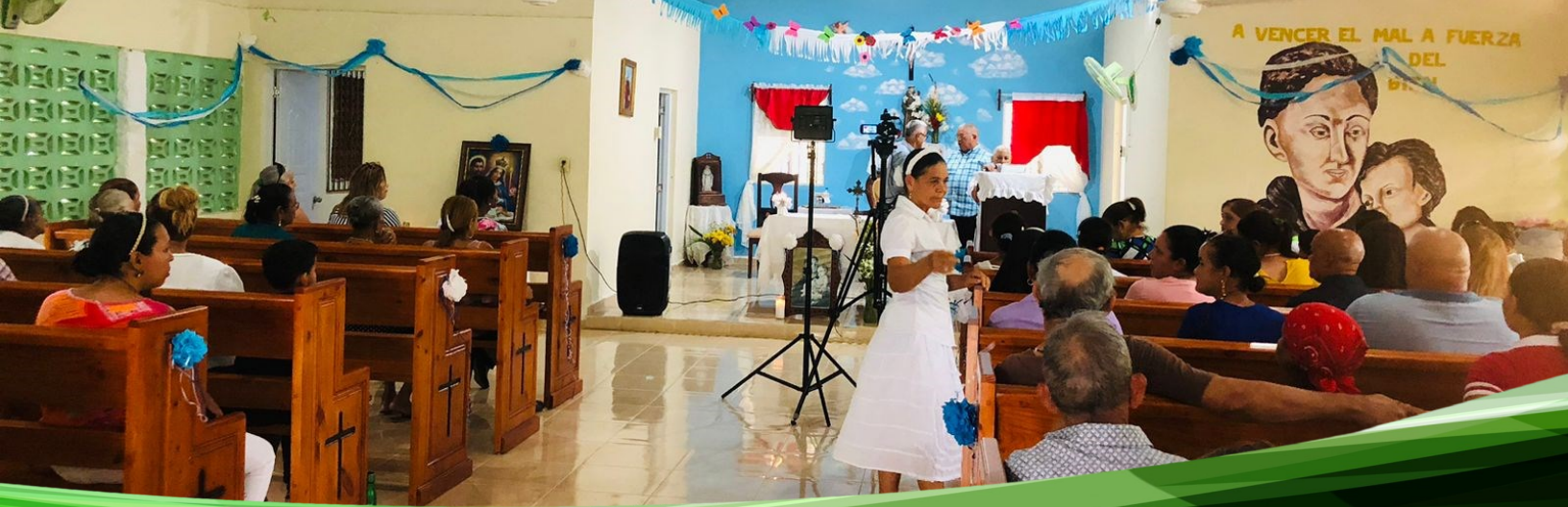
San Antonio de Padua hicimos entrega del remozamiento en la Capilla San Antonio de Padua de La Destiladora en la misa de culminacion de sus fiesta Patronales. Honor para esta gestión darles respuesta a esta comunidad que por muchos años estuvo solicitando este remozamiento por mucho tiempo