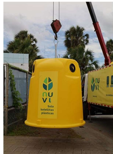
MALECÓN, PLAZA JUAN BARON