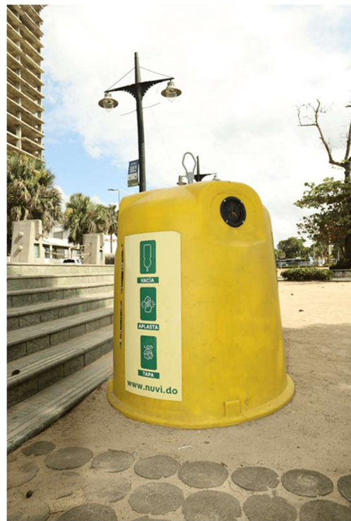
MALECÓN , PLAZA GUIBIA