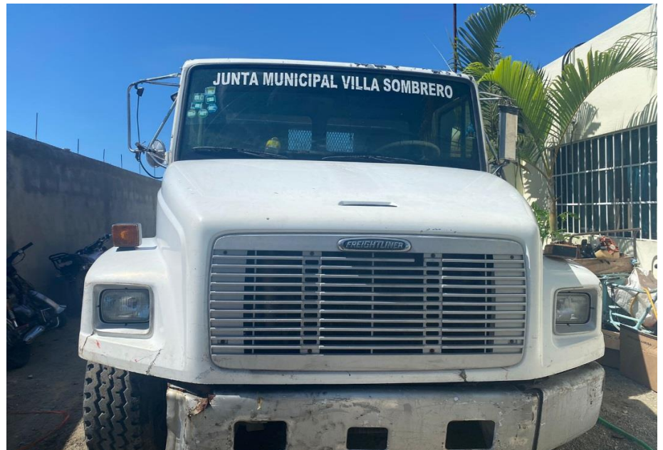
CAMIÓN VOLTEO BLANCO 2004, FREIGHTLINER, 8 TONELADAS. DEBIDAMENTE IDENTIFICADOS.