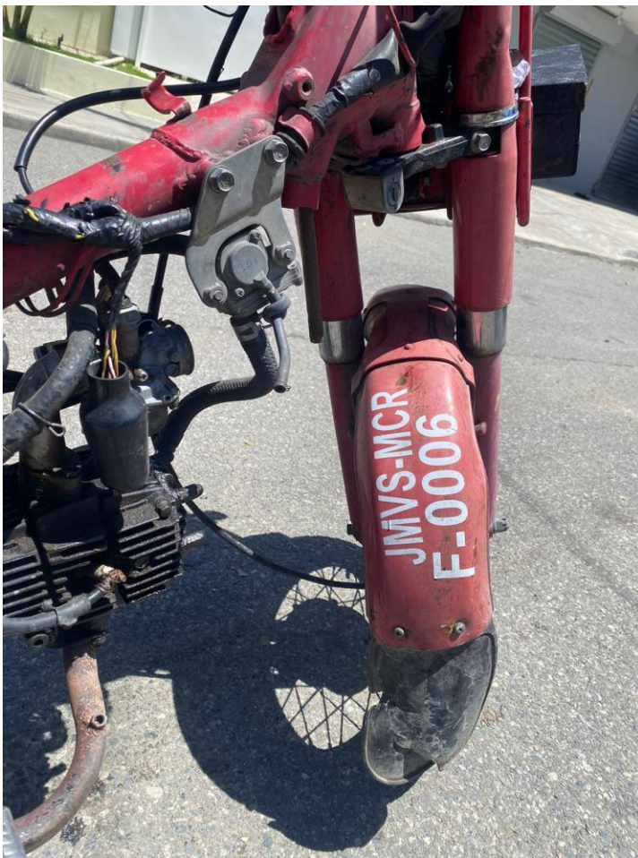
MOTOCILETA DE CARGA ROJO 2022, HONDA, 1 TONELADAS. DEBIDAMENTE IDENTIFICADOS.