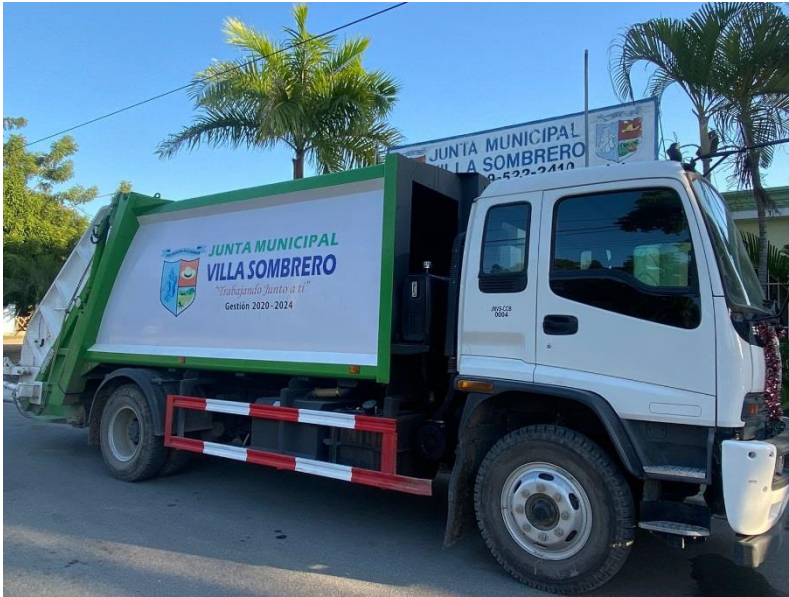
CAMIÓN COMPACTADOR BLANCO 2022, ISUZU, 12 TONELADAS. DEBIDAMENTE IDENTIFICADOS.