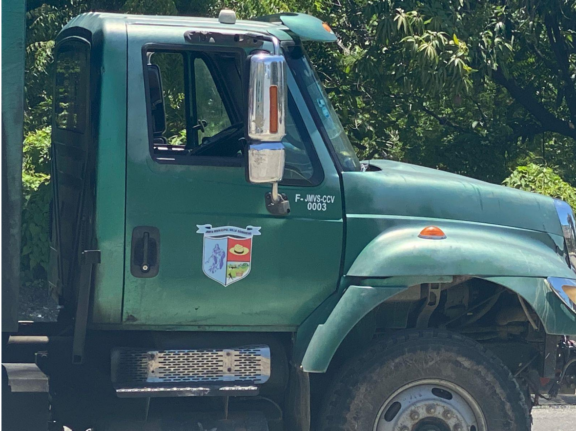
CAMIÓN COMPACTADOR VERDE 2004, INTERNATIONAL, 10 TONELADAS. DEBIDAMENTE IDENTIFICADOS.