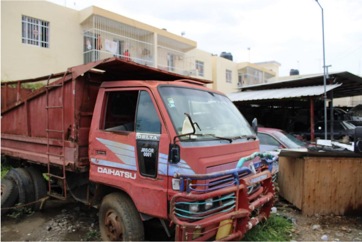
CAMIÓN VOLTEO ROJO 2002, DAIHATSU, 5 TONELADAS. DEBIDAMENTE IDENTIFICADOS. (EN DESUSO)