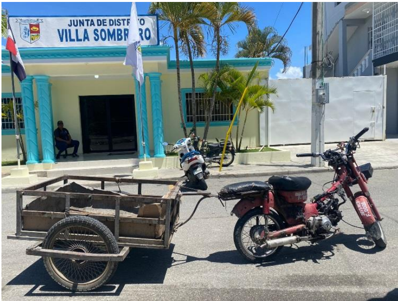
MOTOCILETA DE CARGA ROJO 2022, HONDA, 1 TONELADAS. DEBIDAMENTE IDENTIFICADOS.