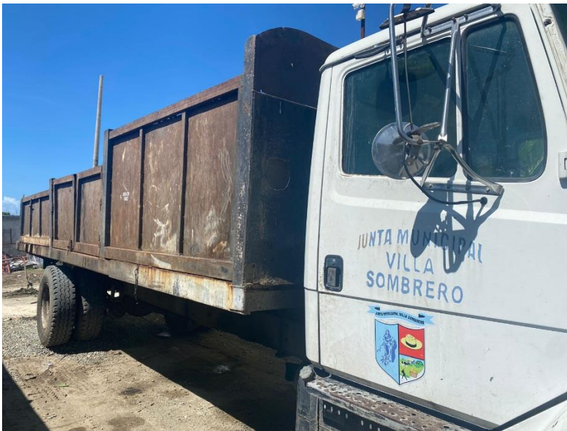
CAMIÓN VOLTEO ROJO 2002, DAIHATSU, 5 TONELADAS. DEBIDAMENTE IDENTIFICADOS. (EN DESUSO)