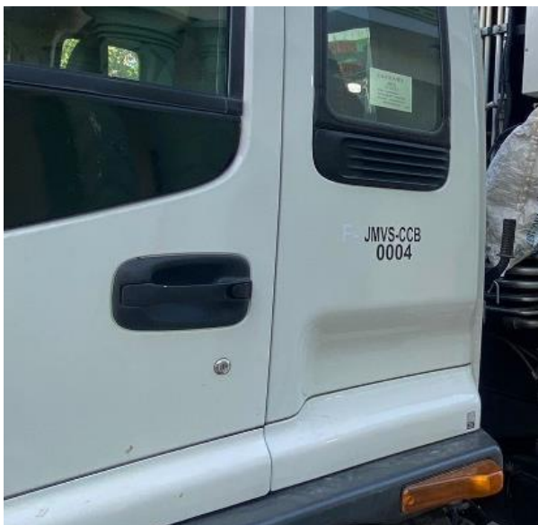
CAMIÓN COMPACTADOR BLANCO 2022, ISUZU, 12 TONELADAS. DEBIDAMENTE IDENTIFICADOS.