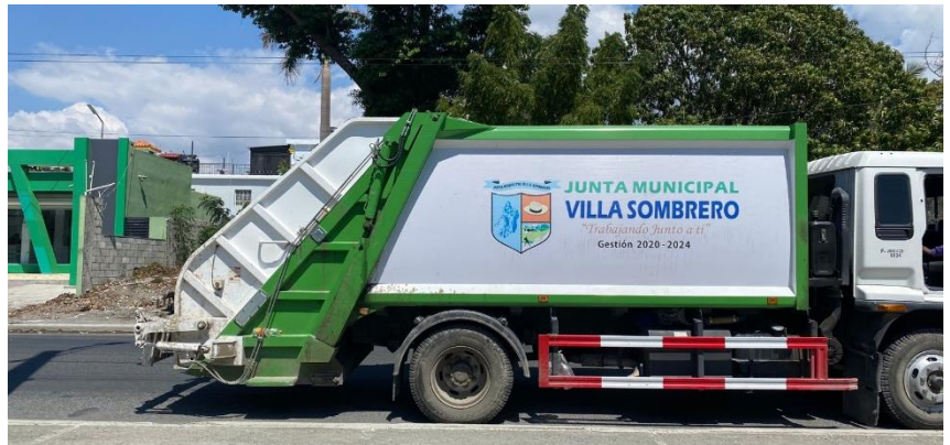
CAMIÓN COMPACTADOR BLANCO 2022, ISUZU, 12 TONELADAS. DEBIDAMENTE IDENTIFICADOS.