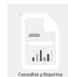
Consultas y Reportes