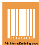
Administración de Ingresos