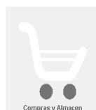
Compras y Almacén