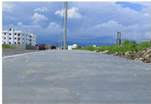
ACERAS BOCA CANASTA