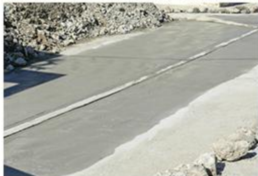
BADÉN EN EL SECTOR 30 DE MAYO