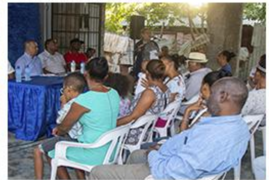
PRIMER PICAZO FUNDO ABAJO REPARACIONES DE BADENES