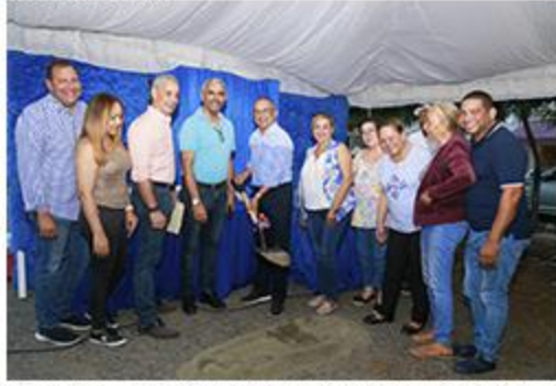
PRIMER PICAZO FUNDACIÓN PERAVIA, PERAVIA Y SANTA ROSA ACERAS, CONTENES Y BADENES.