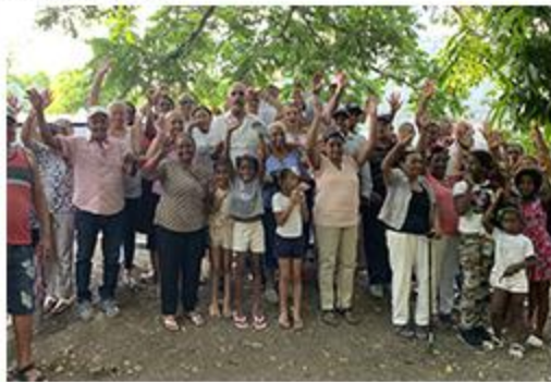
PRIMER PICAZO RESIDENCIAL LOS MAESTROS CONTINUACIÓN ENVERJADO