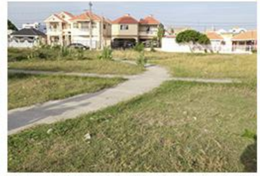
PRIMER PICAZO LAS COLINAS Y PUEBLO NUEVO-LOS MANGUITOS ACERAS Y CONTENES