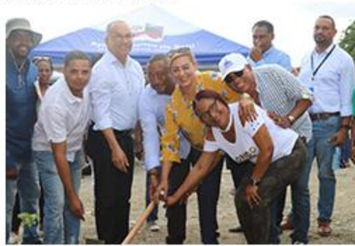
PRIMER PICAZO CAJULITO NORTE CENTRO COMUNAL