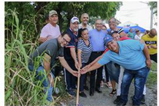
PRIMER PICAZO SECTOR 20 CASITAS PARED PERIMETRAL Y PUERTA HIERRO