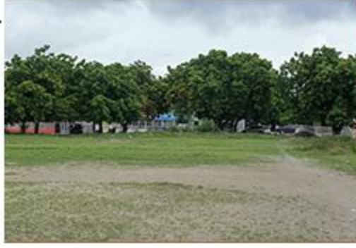
ACERAS Y CONTENES NUEVA ESPERANZA