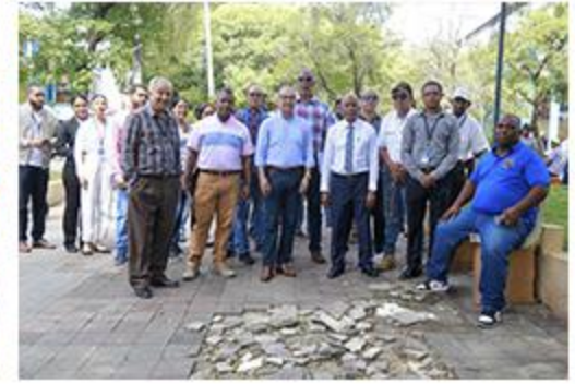
BADEN CALLE LIBERTAD CON JUAN CABALLERO