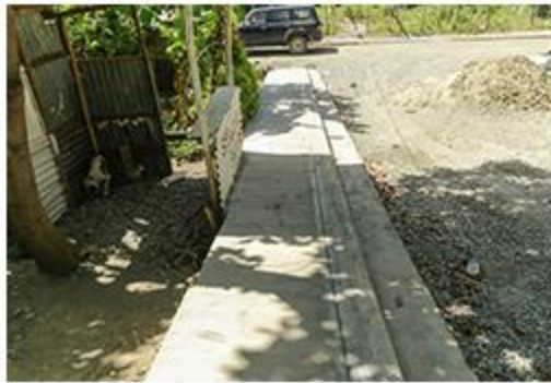
ENCACHE Y CANALETA MATA GORDA