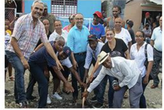
PRIMER PICAZO 19 DE MARZO ACERAS Y CONTENES.