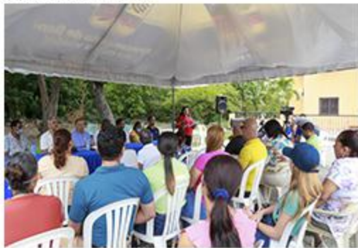
PRIMER PICAZO JESÚS DE NAZARETH CENTRO COMUNAL