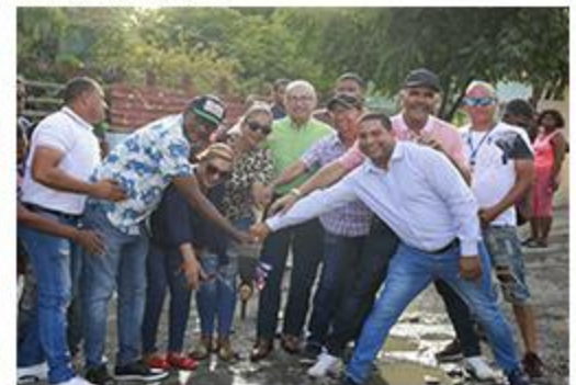
PRIMER PICAZO LAS COLINAS CONTENES.