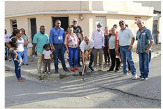
PRIMER PICAZO EL LLANO Y BOCA CANASTA ACERAS Y CONTENES