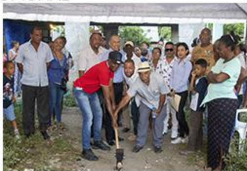
PRIMER PICAZO FUNDO SUR REMOZAMIENTO VERJA PERIMETRAL