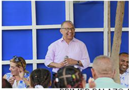
PRIMER PICAZO VILLA CARMEN CONTINUACIÓN CENTRO COMUNAL.