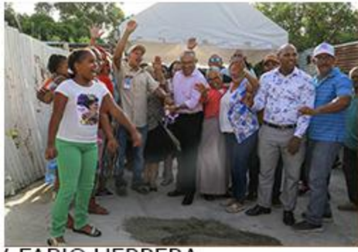
PRIMER PALAZO AV. FABIO HERRERA ACERAS Y CONTENES