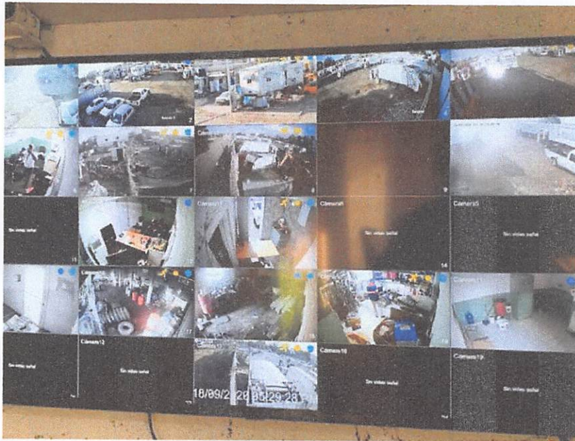
Sistema de cámaras en todo nuestro local de aparcamiento , con vigilancia 24/7