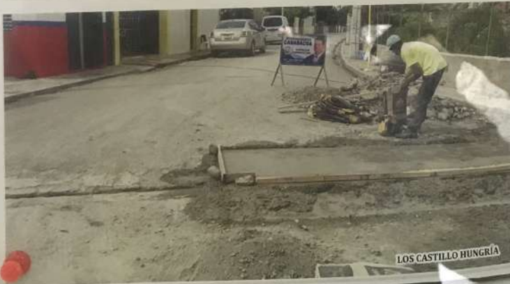
LOS CASTILLO HUNGRIA