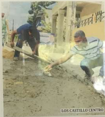
LOS CASTILLO CENTRO