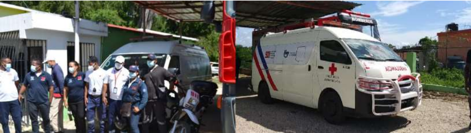
Cancha Cajulito Norte