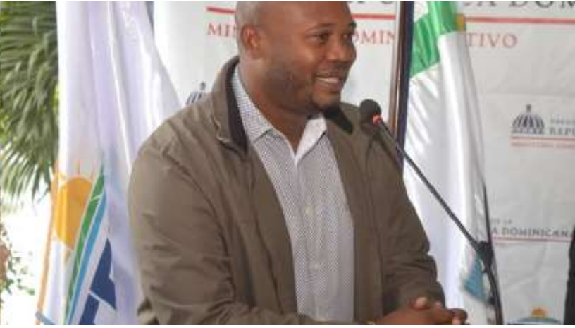
Primer picazo de obras aprobadas