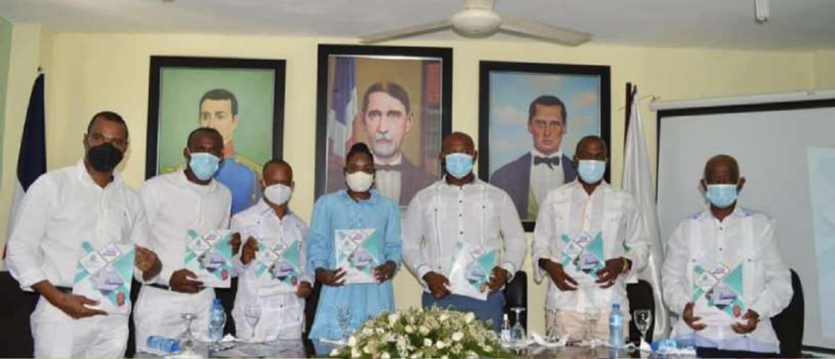
Autoridades Electas / Consejo de Vocales