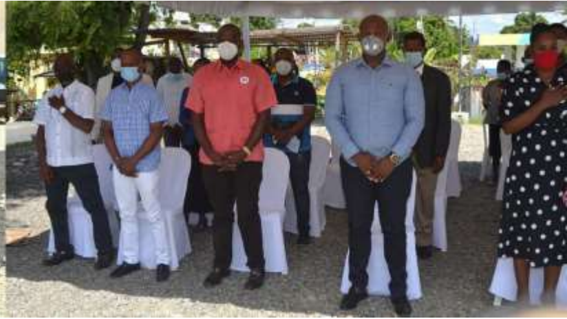
Evento Cambio Climatico