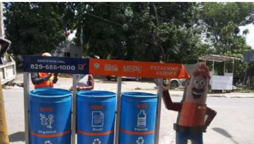
Vertedero improvisado Calvario