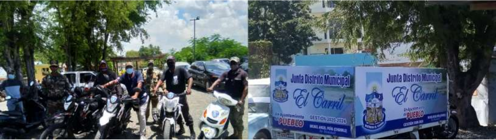
Camión compactador nuevo / Carro funebre