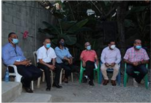
PRIMER PICAZO ACONDICIONAMIENTO CAÑADA BOCA CANASTA