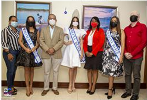
RATIFICACION REINAS FIESTAS PATRONALES