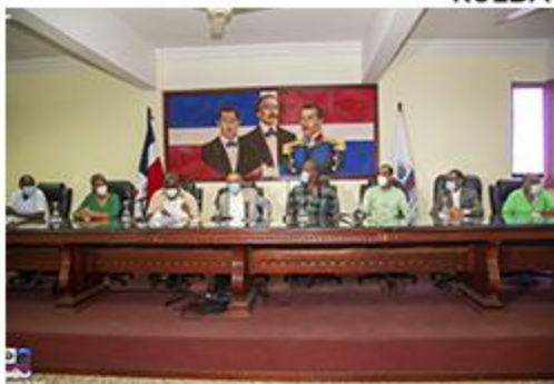
RUEDA DE PRENSA