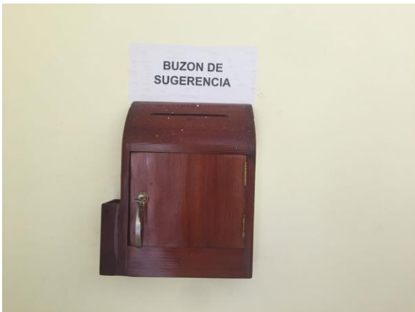
Buzón de sugerencia

SUBCRITERIO 4.1. Desarrollar y gestionar alianzas con organizaciones relevantes.