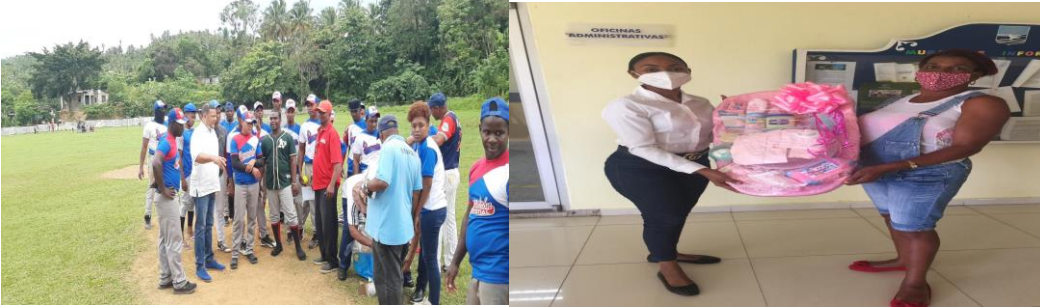
Alcalde aportando bolas a equipo de pelota. Entrega de canastilla a mujer embarazada.