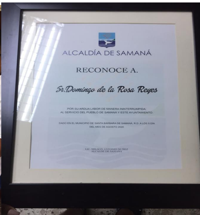
Enc. De RRHH, haciendo entrega de reconocimiento a empleado de ornato por su ardua labor de manera ininterrumpida.