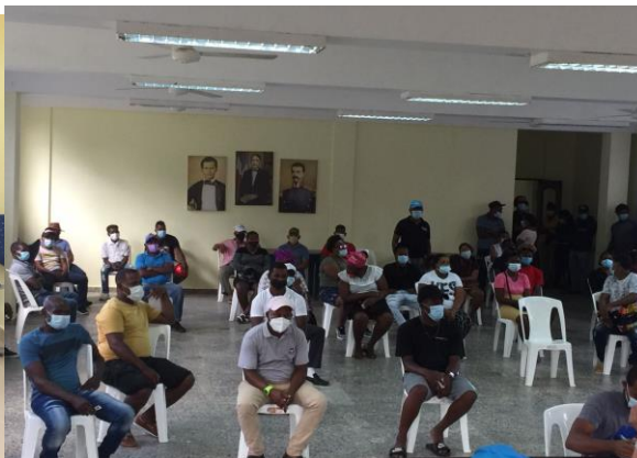
Reunión con Motoconchistas.