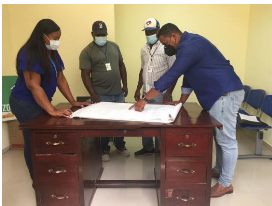
Oficinas de la OMPU y Planificación