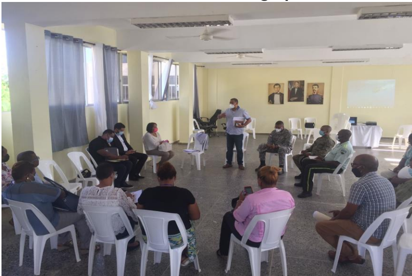
Reunión con la Mesa Ciudadano.

SUBCRITERIO 5.1. Identificar, diseñar, gestionar e innovar en los procesos de forma continua, involucrando a los grupos de interés.