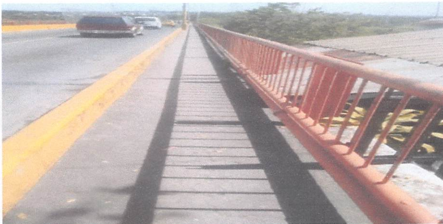
BRIGADA DE BARRIDO DE LA MAÑANA EN LA CIRC. 3,