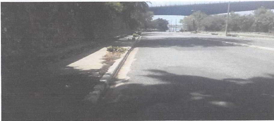
BRIGADA DE BARRIDO EN LA CIRC. 2, PUENTE SABANA PENDIDA