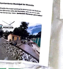
Ayuntamiento Monción El ayuntamiento Municipal de Monción continúa la construcción de badenes en el Sector de Barrio Nuevo #Gestión 2020-2024