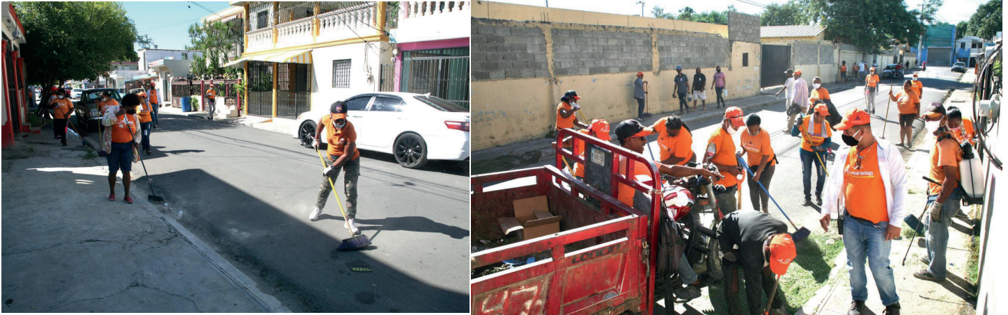
Jornada abarcó limpieza de parques, mercados, cementerios y plazas públicas

El Ayuntamiento de Santiago, intervino ayer sábado calles, avenidas, barrios y urbanizaciones en el gran operativo, “Santiago en Orden” , dispuesto por el alcalde Abel Martínez, retirando desechos acumulados en patios, a orillas de aceras, reatas, parques, mercados, cementerios, plazas públicas, retirando malezas y podando árboles.