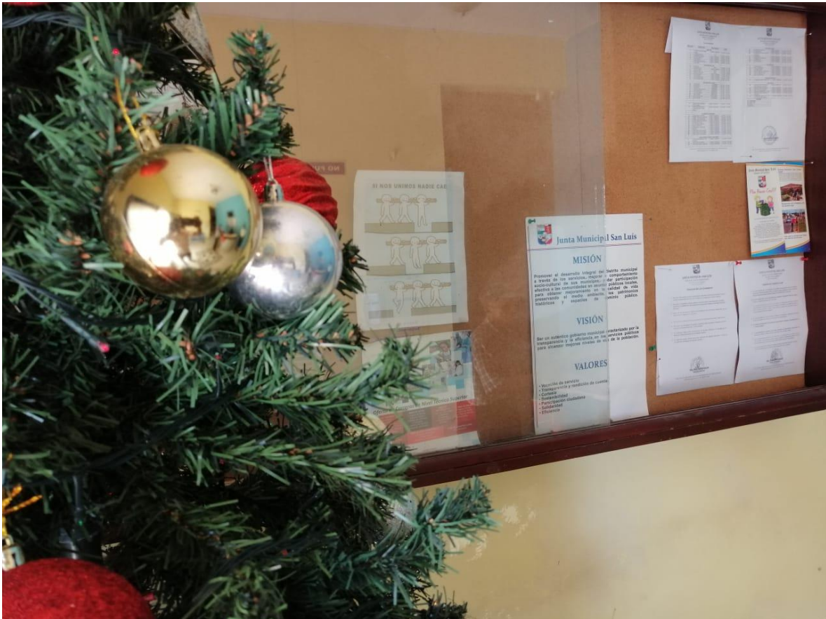
MURAL EDIFICIO 1