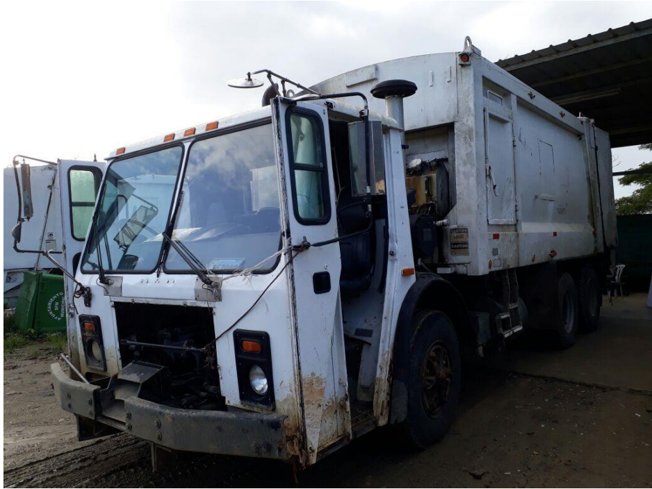
CAMION MACK, TIPO COMPACTADOR MARCADO COMO FICHA 09.