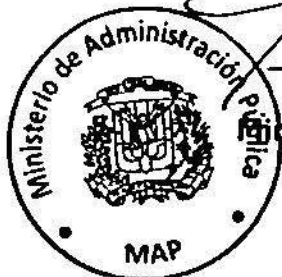
Lic. Ramón Ventura Camejo Ministro de Administración Pública