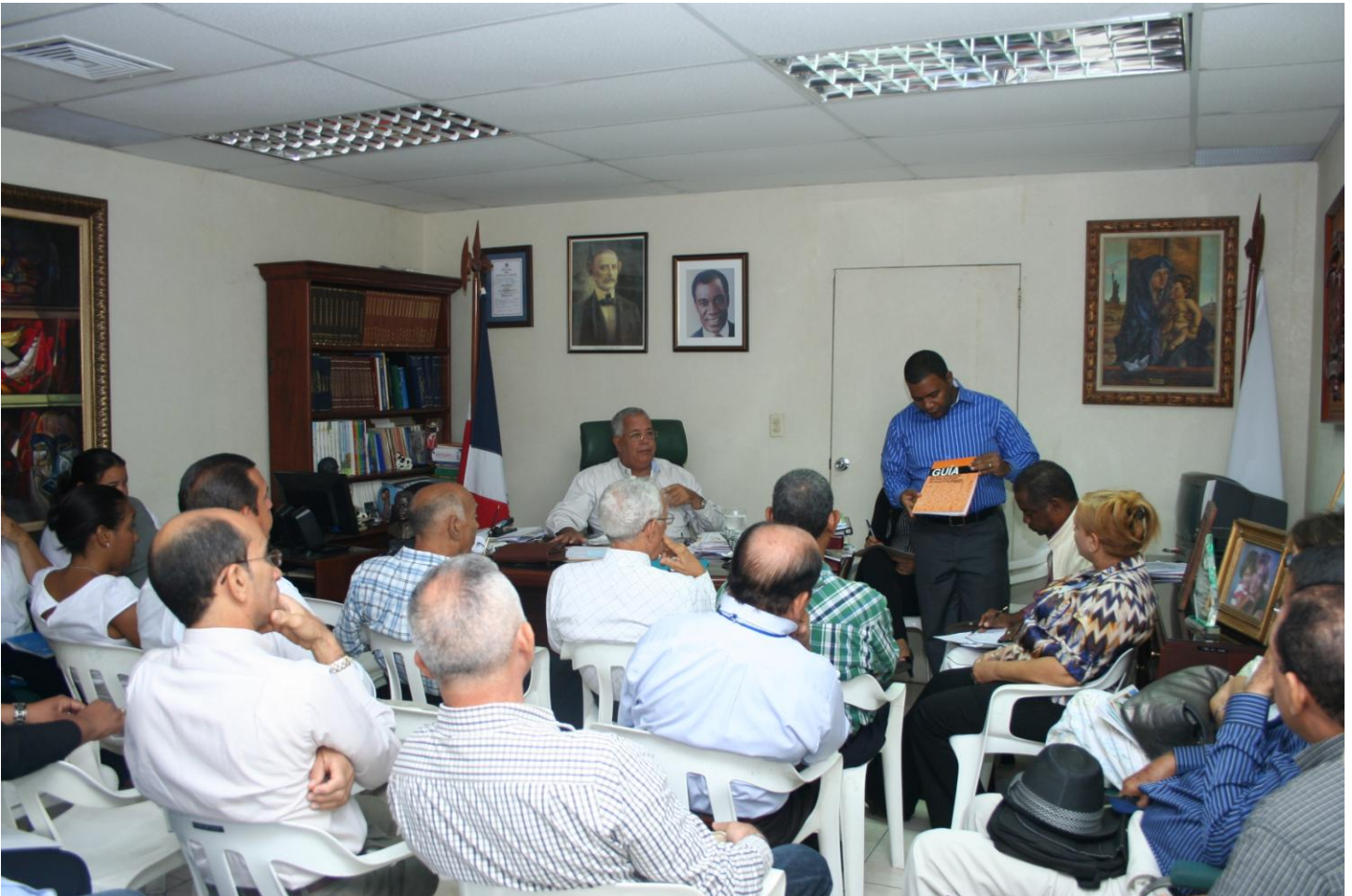
Socialización a los Directores/Encargado de Departamento y el Alcalde Municipal sobre la importancia de la Planificación en la Gestión Municipal y para ello se le ilustra sobre la GUIA de planificación, elaborada por el PROYECTO-FEDOMU PLANIFICA.

5. Para avanzar en las tareas programadas, entendimos prudente realizar la socialización con los encargados/directores y empleados medios del ayuntamiento, sobre la nueva oficina de planificación y programación (OMPP) y la planificación con herramienta en la vida municipal, así como la importancia de la creación del Plan Municipal de Desarrollo (PMD), en la que distribuimos las diapositivas que nos enviaron como material de apoyo el cual modificamos para tales fines.