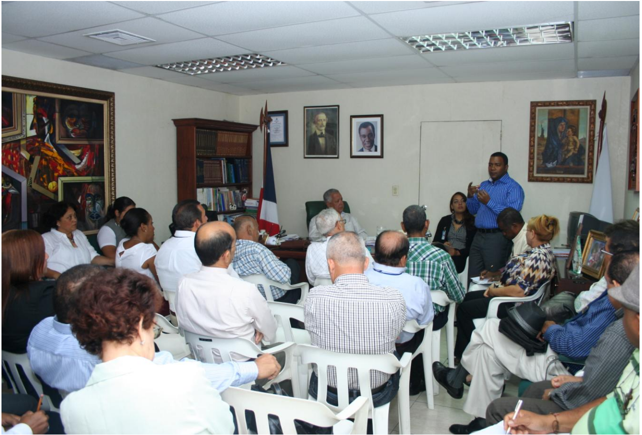
Otras Tomas de fotografías de la Socialización a los Directores/Encargado de Departamento y el Alcalde Municipal sobre la importancia de la Planificación en la Gestión Municipal y para ello se le ilustra sobre la GUIA de planificación, elaborada por el PROYECTO-FEDOMU PLANIFICA.