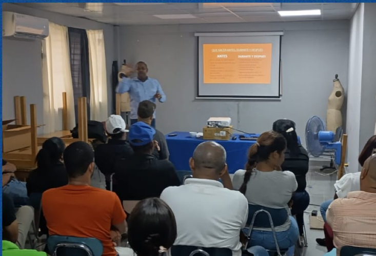
Charla de prevención de desastres naturales en la Nave (Zona oriental)