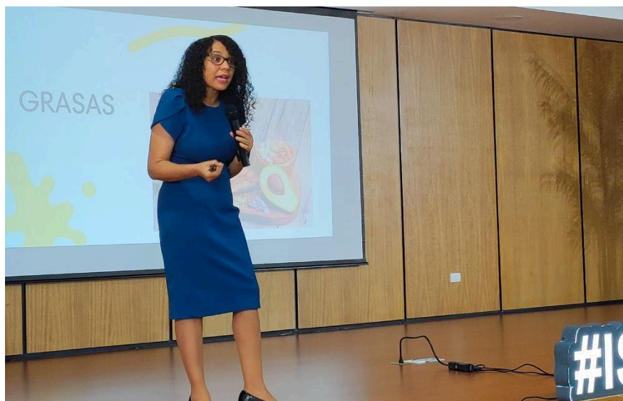
Charla Salud y Nutrición