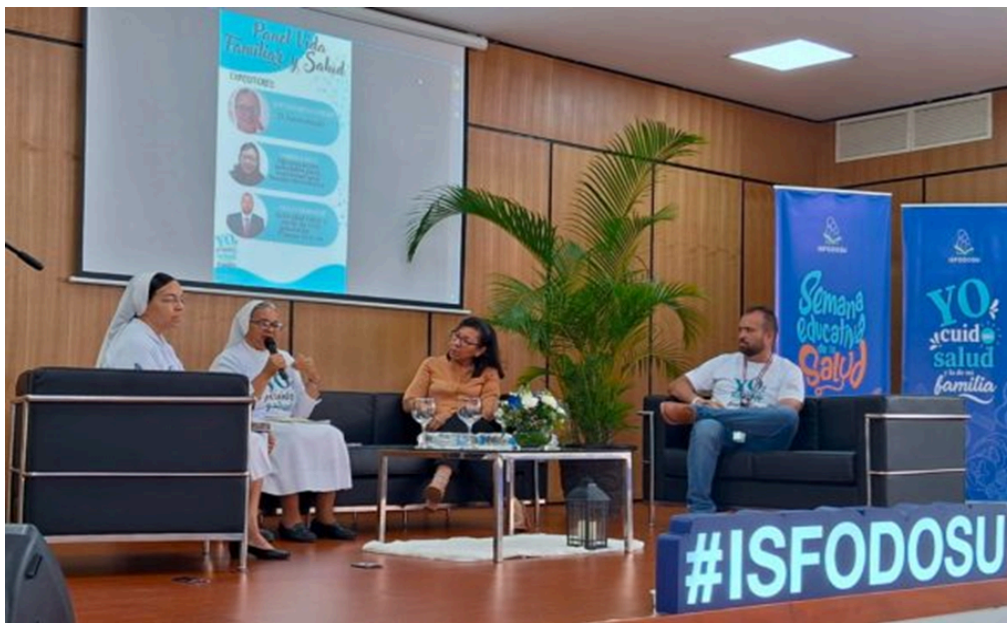
Panel Vida Familiar Saludable