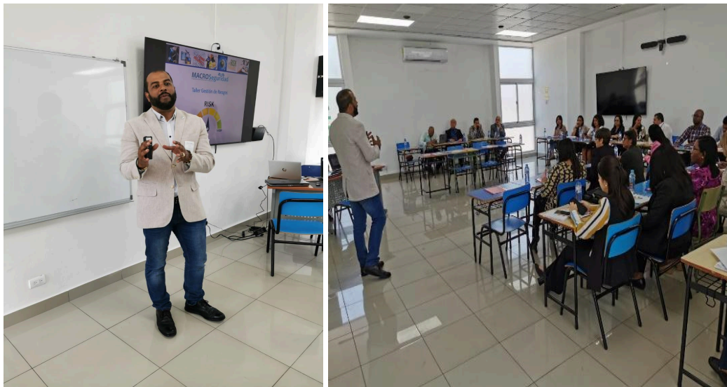
Taller de Gestión de Riesgos