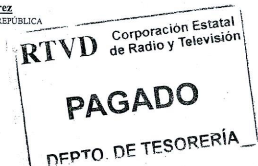
Geraldo Espinosa Pérez SUBCONTRALOR GENERAL DE LA REPÚBLICA