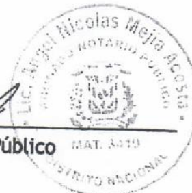
Notario Público MAT. 3079