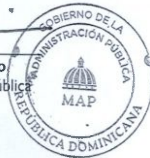
Lic. Darío Castillo Lugo Ministro de Administración Pública

Resolución núm. 424-2023, que aprueba la Tercera Versión de la Carta Compromiso al Ciudadano de la Dirección General de Información y Defensa de los Afiliados a la Seguridad Social (DIDA).