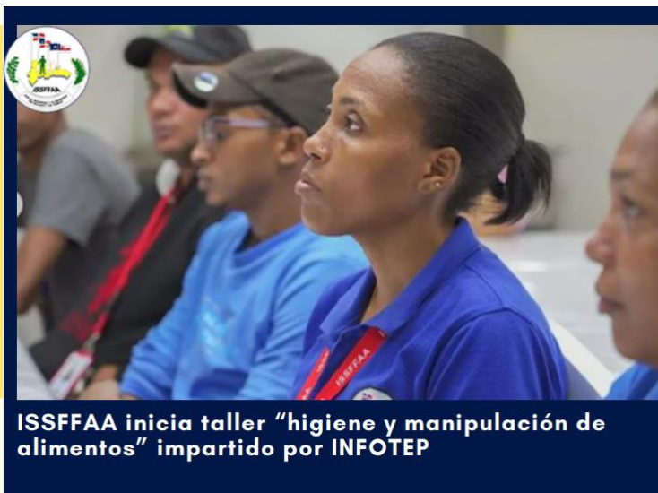
ISSFFAA inicia taller "higiene y manipulación de alimentos" impartido por INFOTEP