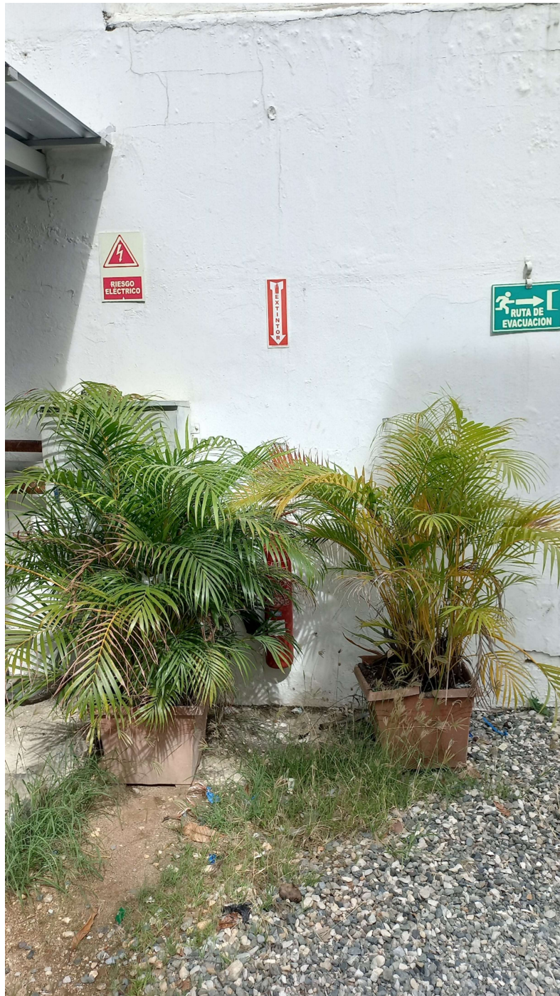
Extintor 674818 Patio, frente a la planta eléctrica.