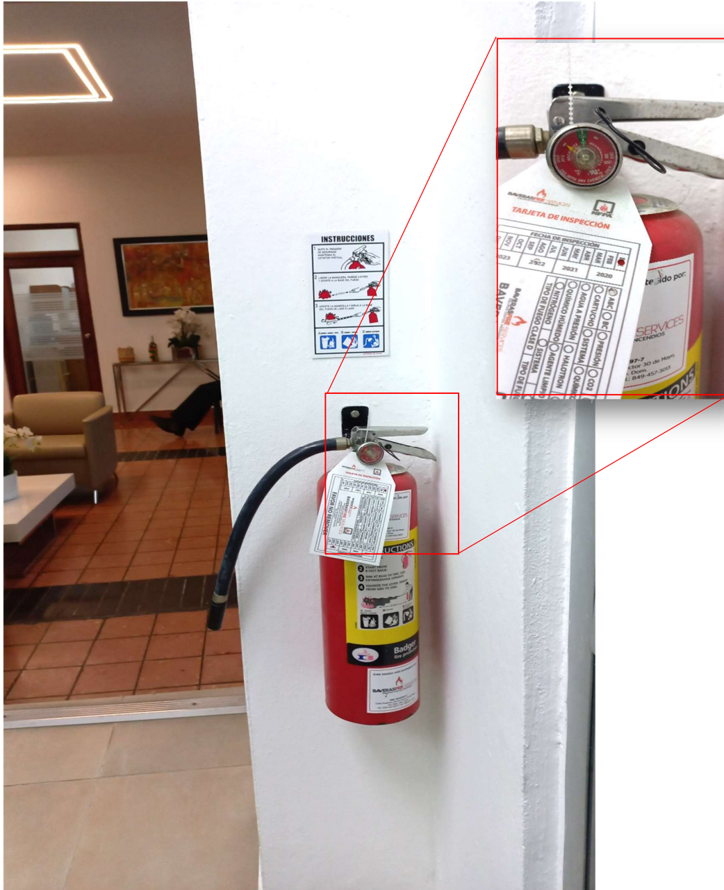
Extintor 674086 Pasillo hacia Dpto. de Pensiones (2do nivel)