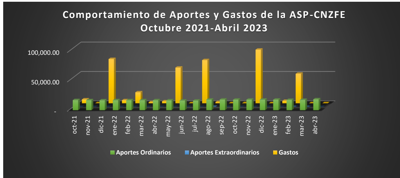
Ilustración 1 Comportamiento de Aportes y Gastos de la ASP-CNZFE. Octubre 2021-Abril 2023

De forma gráfica, se puede observar la estabilidad en los ingresos y los gastos puntuales, según las actividades programadas por la ASP, durante el período correspondiente.