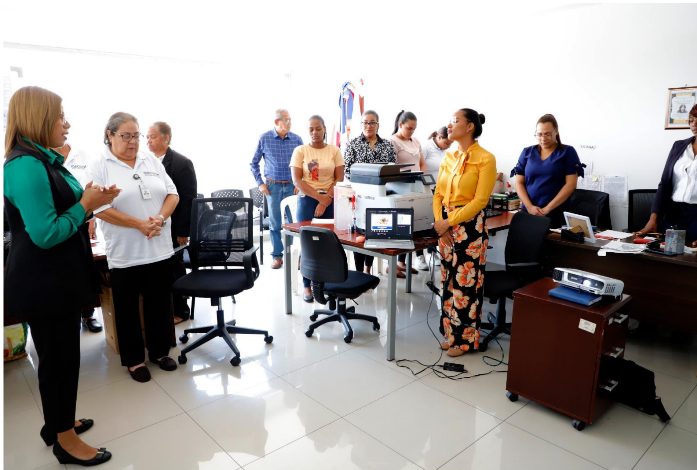
Centro Regional Santo Domingo Este

Además, impartimos la Charla " Manejo de Conflictos" en los Centros Regionales de Santo Domingo Este, Suroeste-Azua y Valdesia-San Cristóbal