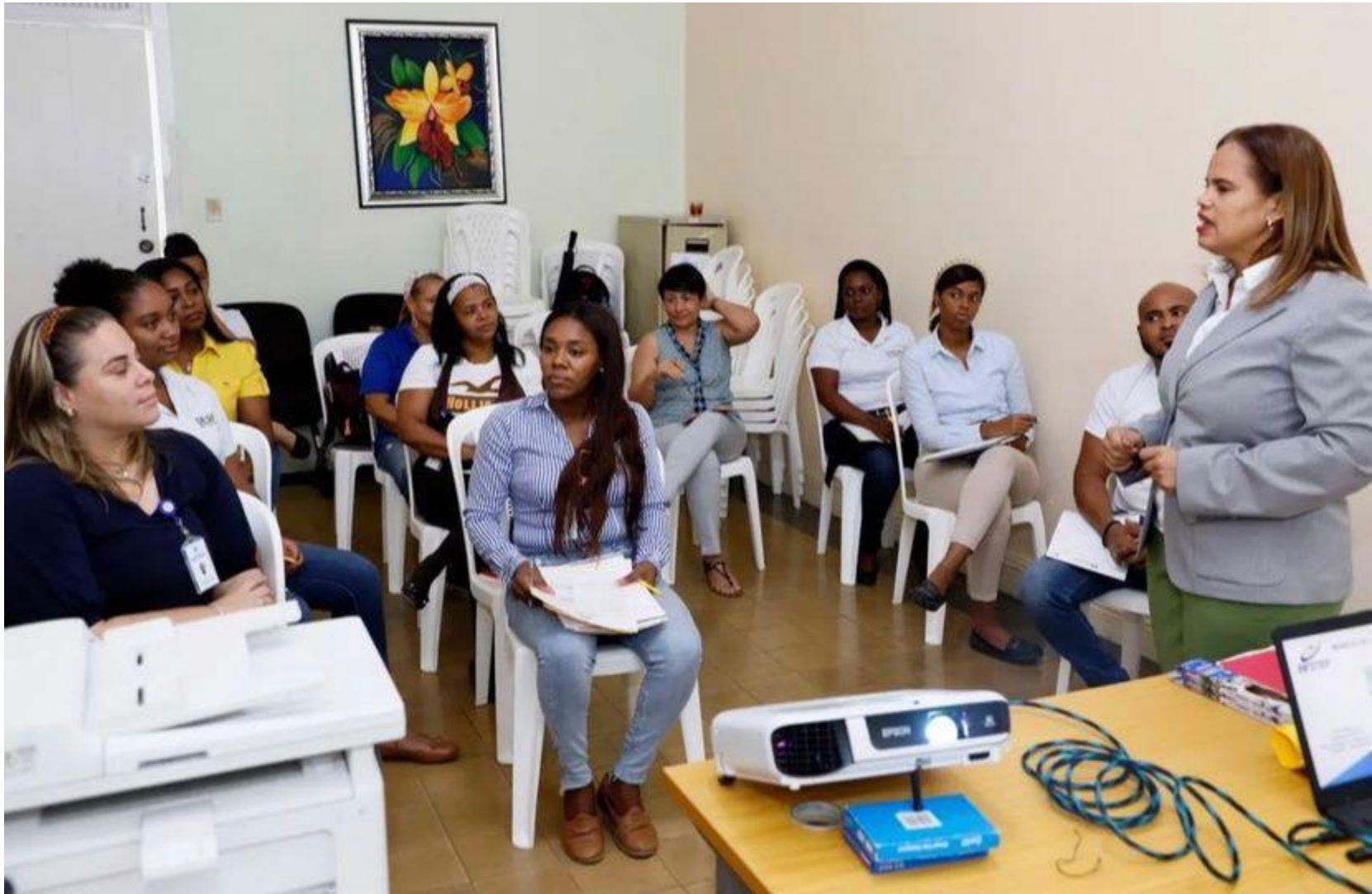
Centro Regional Valdesia-San Cristóbal