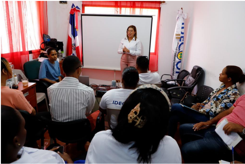
Centro Regional Suroeste-Azua