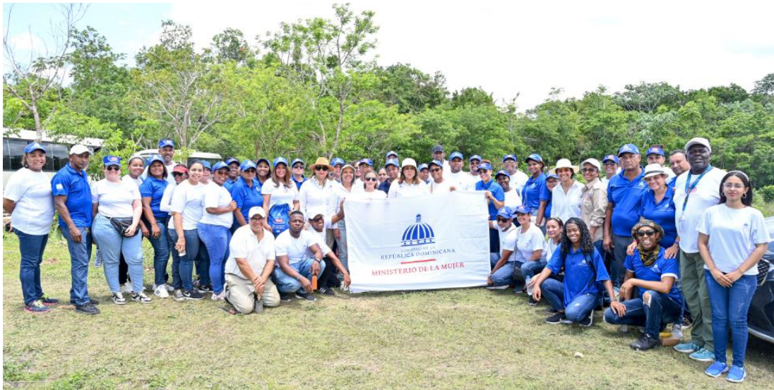
Servidoras y servidores, terminada la siembra de árboles en Bayaguana, 17 de junio del 2023