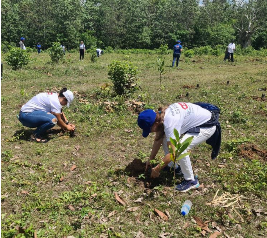
Servidoras y servidores, siembran árboles en Bayaguana, junio del 2023