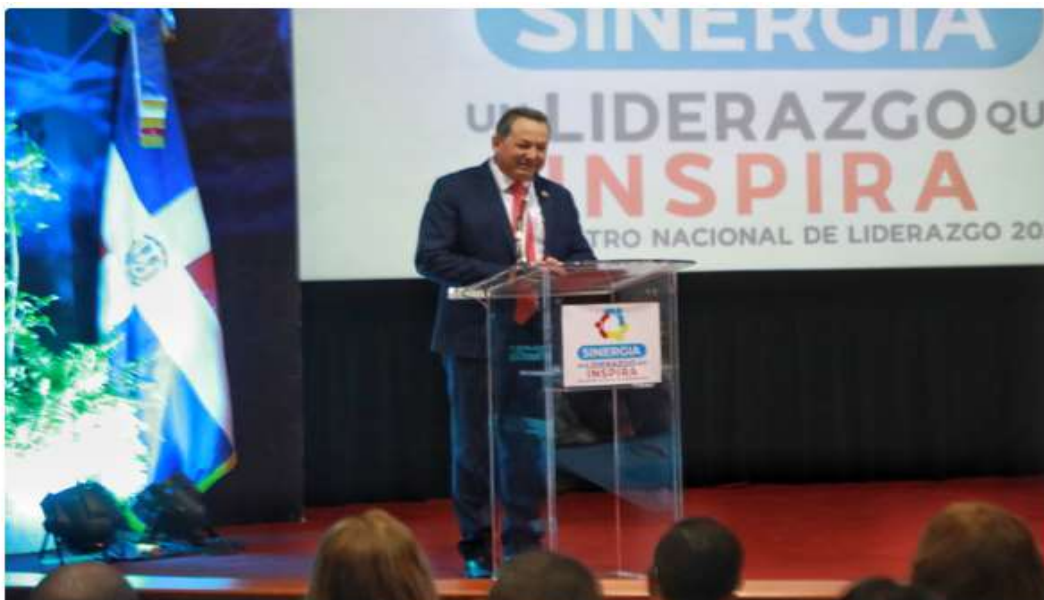
Promipyme celebra Encuentro Nacional de Liderazgo 2023: "liderazgo que Inspira"