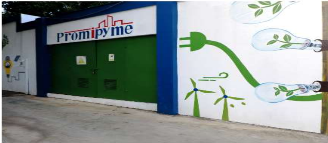
Promipyme Inaugura: "Punto Verde Promipyme" y Devela tres Murales Medioambientales