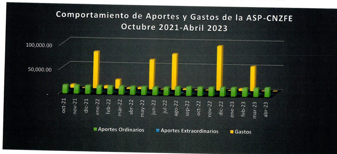
Ilustración 1 Comportamiento de Aportes y Gastos de la ASP-CNZFE. Octubre 2021-Abril 2023

Leopoldo Navarro #61, Edif. San Rafael. 5to piso, Santo Domingo, República Dominicana, RNC.430240559, Apdo. Postal 21430 Tel.: 809-686-8077 Fax: 809-686-8079, Correo electrónico: asp@cnzfe.gob.do