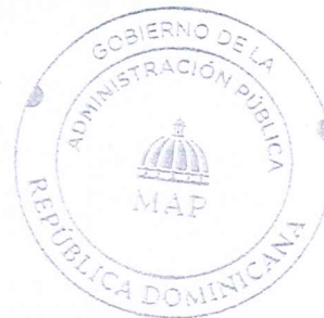
DARÍO CASTILLO LUGO Ministro de Administración Pública

Refrendada por el Ministerio de Administración Pública