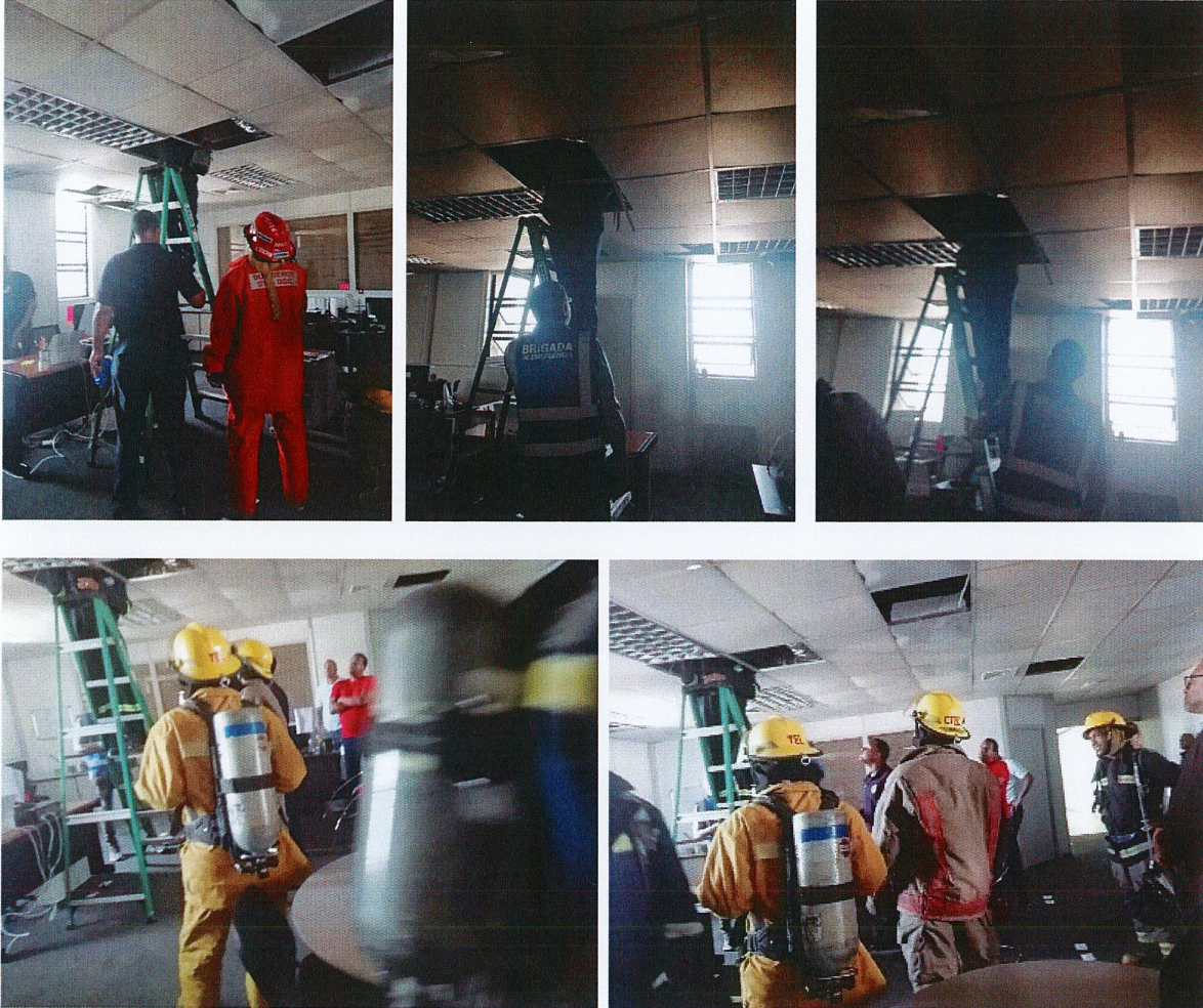
Imágenes que evidencian los agentes del cuerpo de bomberos resolviendo el sistema de los aires del INAP.