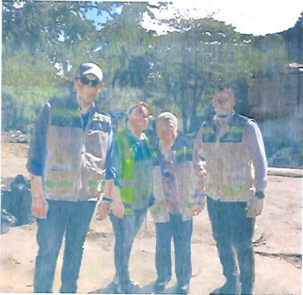
Reconocimiento del área del Sector El Aguacate