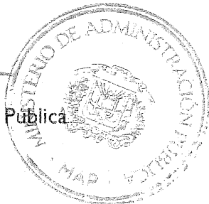
Darío Castillo Lugo Ministro de Administración Pública DCL/JP/DATR/FB/dmv