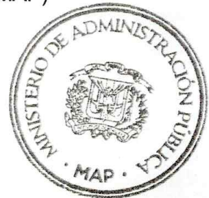
Darío Castillo Lugo Ministro de Administración Pública

Refrendada por el Ministerio de Administración Pública (MAP)