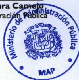
Lic. Ramón Ventura Camejo Ministro de Administración Pública

Refrendada por el Ministerio de Administración Pública