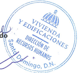
Coronel Fidel Félix FARD Miembro