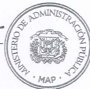
Lic. Tomás Darío Castillo Lugo Ministro de Administración Pública