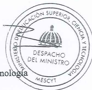
Dr. Franklin García Fermín Ministro de Educación Superior, Ciencia y Tecnología