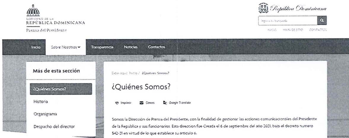
Figura 2: Actualmente en su portal web no muestran servicios